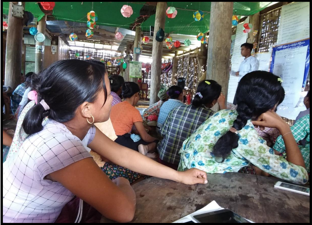
၇.၁။ ကျေးရွာအစည်းအဝေးနှင့် PRA Tools များအသုံးပြု၍ အချက်အလက်ကောက်ခံခြင်း