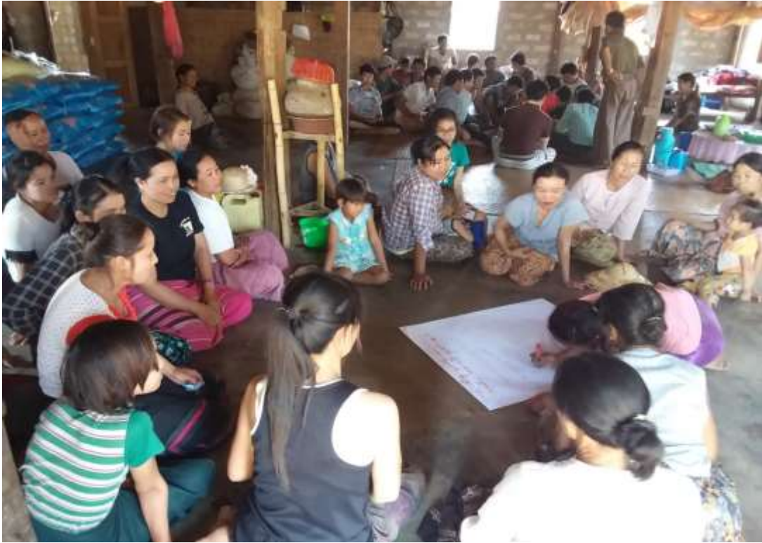
အခက်အခဲ၊ မျက်မှန်းချက်နှင့် ကျေးရွာဖွံ့ဖြိုးရေးလုပ်ငန်းများအတွက် အမျိုးသမီးများတက်ကြွစွာ ဆွေးနွေးနေပုံ