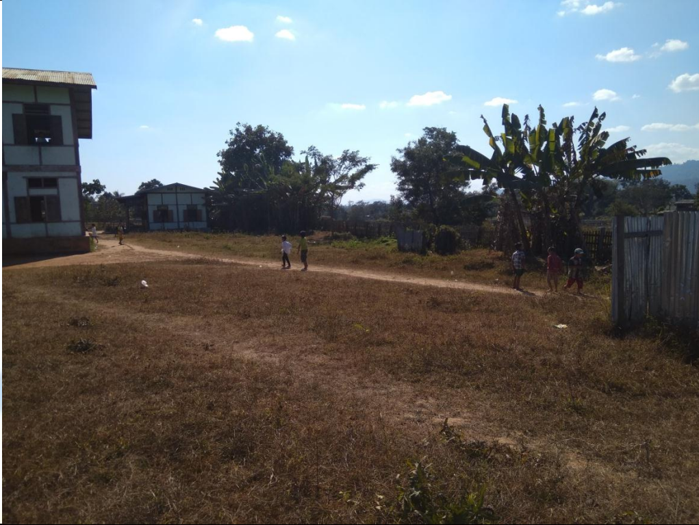
ပထမနှစ်စီမံကိန်းလုပ်ငန်းခွဲဆောင်ရွက်စီးမှုမှတ်တမ်းဓါတ်ပုံ