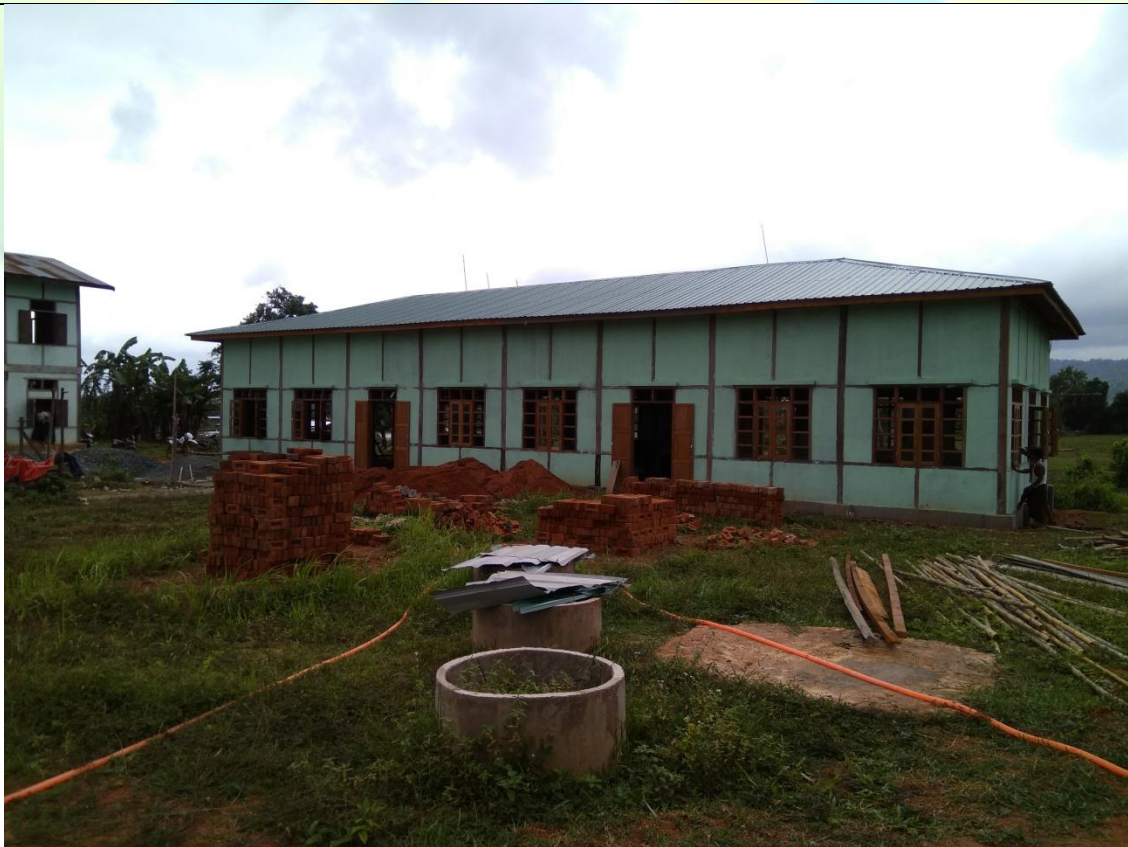
ပထမနှစ်စီမံကိန်းလုပ်ငန်းခွဲဆောင်ရွက်ပြီးစီးမှုမှတ်တမ်းဓါတ်ပုံ