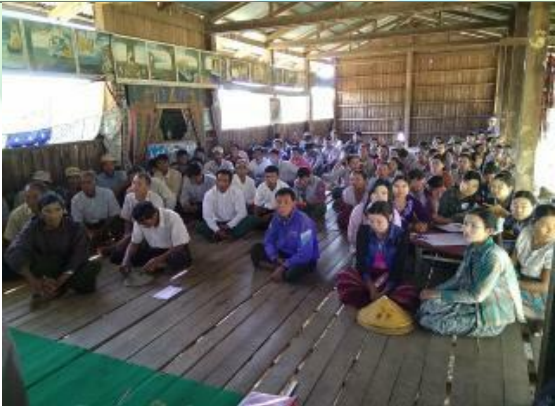
ကော်မတီရွေးချယ်ခြင်း မှတ်တမ်းဓာတ်ပုံ