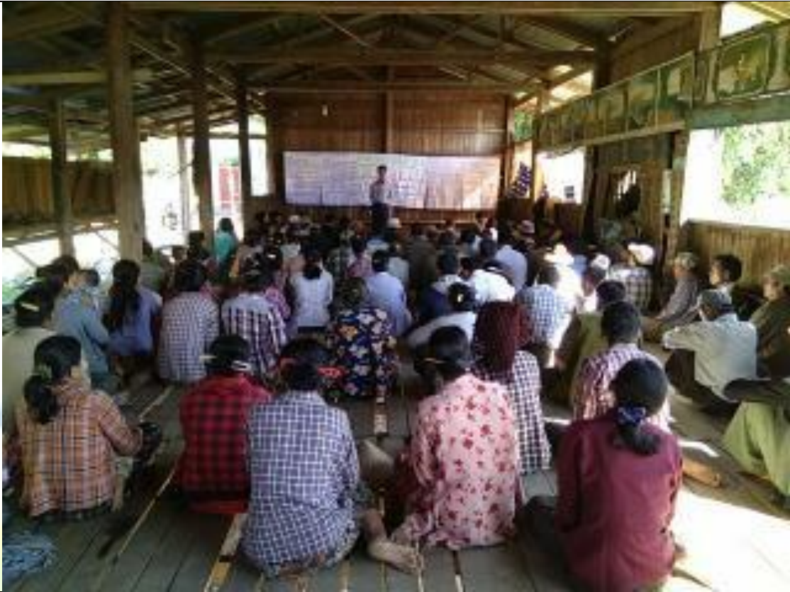
စေတနာ့ဝန်ထမ်းများ ရွေးချယ်ခြင်း မှတ်တမ်းဓာတ်ပုံ