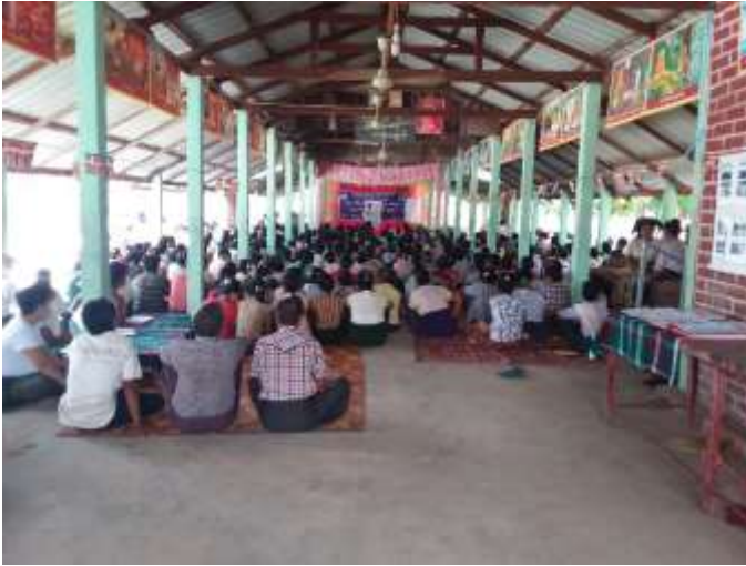
၇။ (က)ကော်မတီဝင်များရွေးချယ်ခြင်းနှင့် ကျေးရွာဖွံ့ဖြိုးရေးအစီအစဉ်ဆောင်ရွက်မှုမှတ်တမ်းဓါတ်ပုံများ