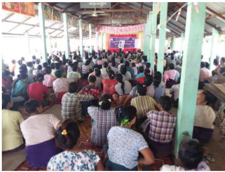
Village Development Plan (VDP)