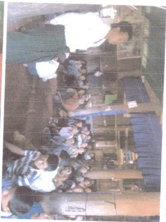
စွယ်တော်မြောင်းကျေးရွာ အစည်းအဝေးကျင်းပနေပုံများ