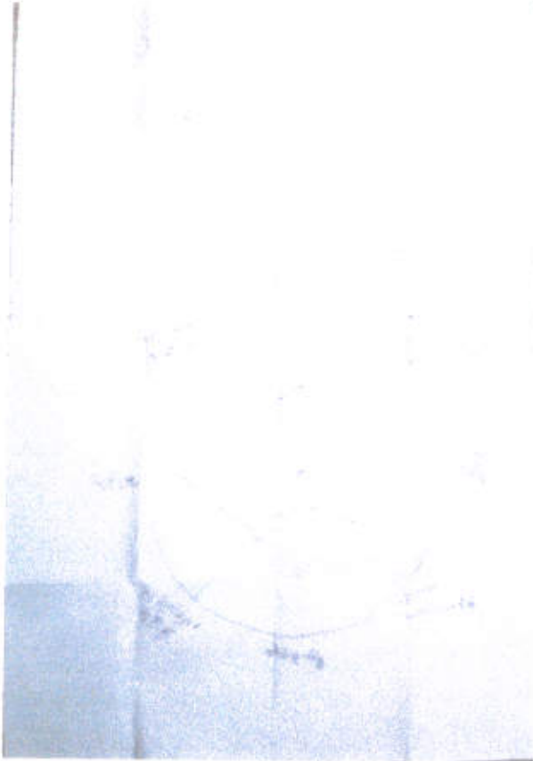
အမျိုးသား ပင့်ကူအိမ်