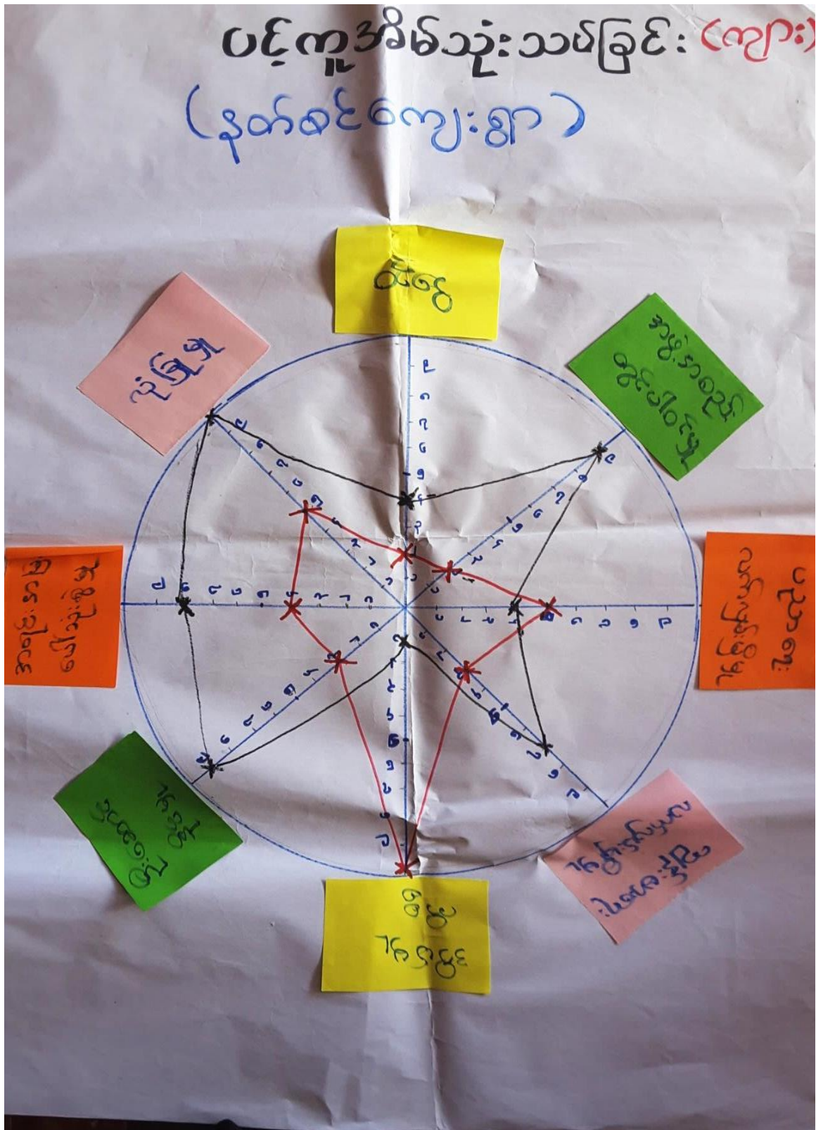
နတ်စင်ကျေးရွာ၊ပန်းကုန်းကျေးရွာအုပ်စု။