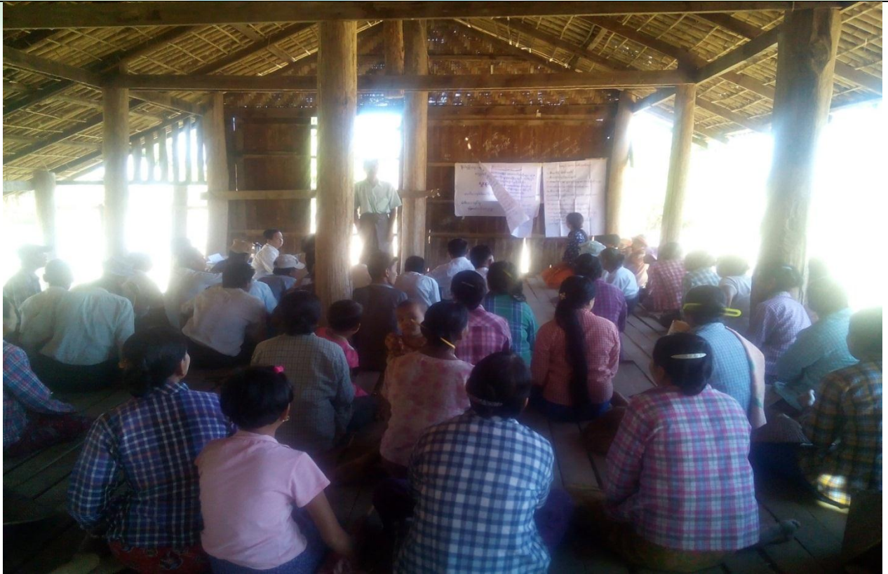
ကော်မတီရွေးချယ်ခြင်း မှတ်တမ်းဓါတ်ပုံ