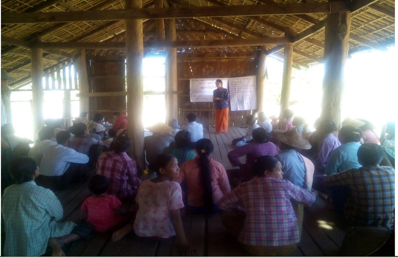
စေတနာ့ဝန်ထမ်းများ ရွေးချယ်ခြင်း မှတ်တမ်းဓါတ်ပုံ