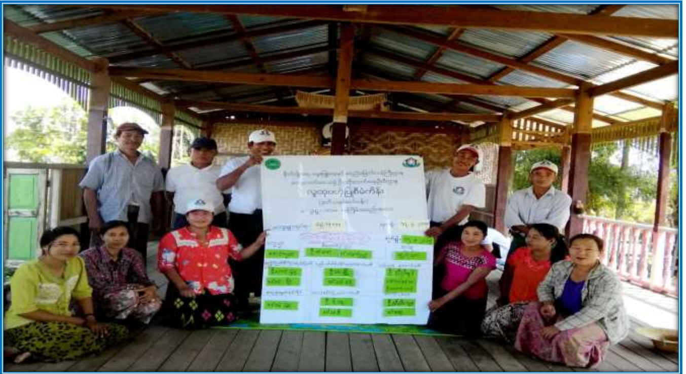
၇။ ကော်မတီဝင်များရွေးချယ်ခြင်းနှင့် ကျေးရွာဖွံ့ဖြိုးရေးအစီအစဉ်ဆောင်ရွက်နေမှု မှတ်တမ်းဓာတ်ပုံများ