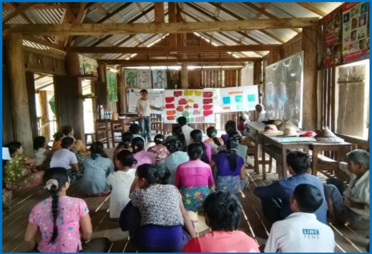
၇။ ကော်မတီဝင်များရွေးချယ်ခြင်းနှင့် ကျေးရွာဖွံ့ဖြိုးရေးအစီအစဉ်ဆောင်ရွက်မှု မှတ်တမ်းဓာတ်ပုံများ