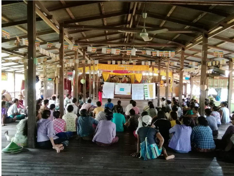
၇။ ကော်မတီဝင်များရွေးချယ်ခြင်းနှင့်ကျေးရွာဖွံ့ဖြိုးရေးအစီအစဉ်ဆောင်ရွက်မှု မှတ်တမ်းဓာတ်ပုံ