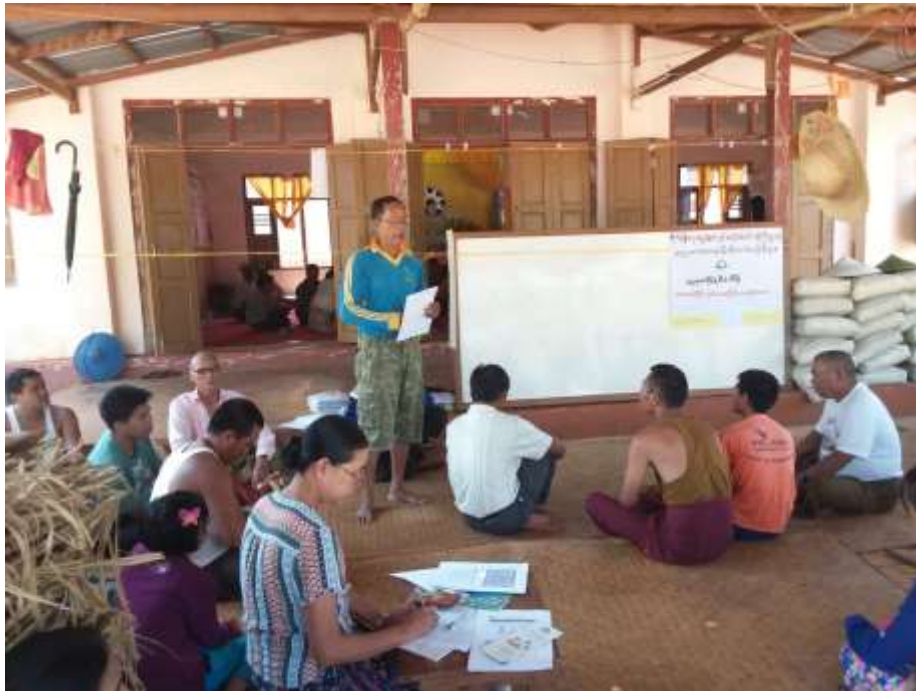
ကျေးရွာဖွံ့ဖြိုးရေးအစီစဉ်