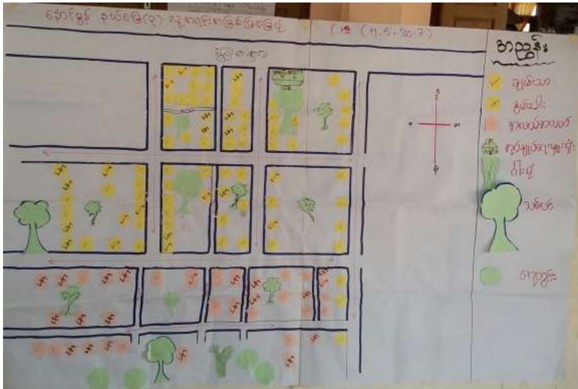
ကျေးရွာမြေပုံဆန်းစစ်ချက်