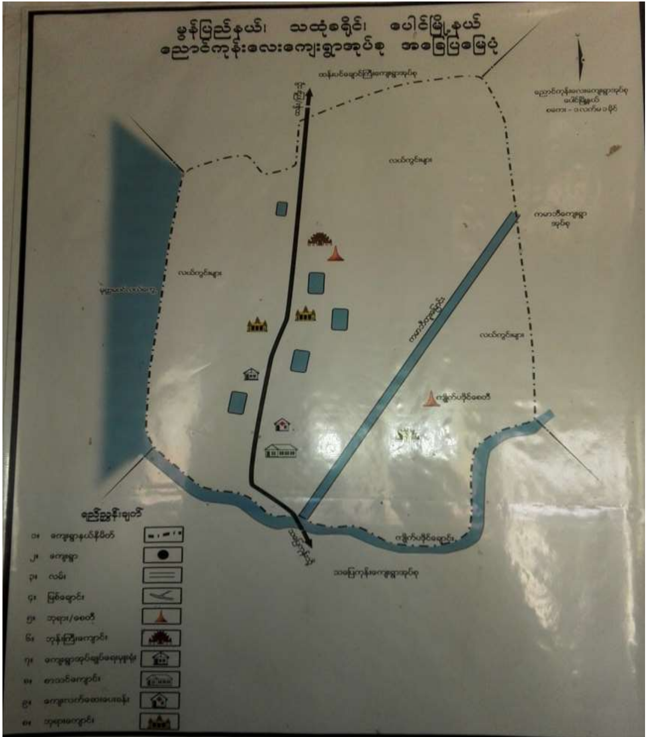
ညောင်ကုန်းလေးကျေးရွာ၊ညောင်ကုန်းလေးကျေးရွာအုပ်စု၊ပေါင်မြို့နယ်။