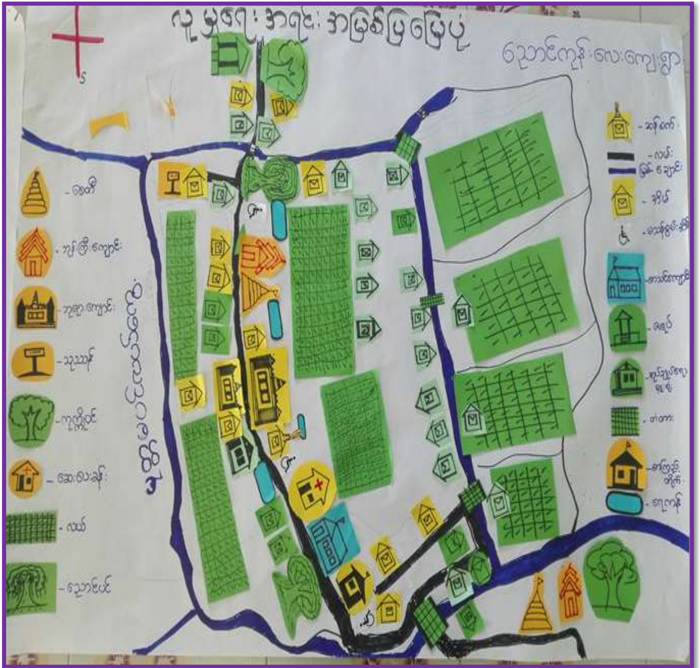
ညောင်ကုန်းလေးကျေးရွာ၊ ညောင်ကုန်းလေးကျေးရွာအုပ်စု၊ ပေါင်မြို့နယ်။

လူမှုရေးအရင်းမြစ်ပြမြေပုံ၊ ဆွေးနွေးခြင်းနှင့်ဆန်းစစ်ခြင်း သုံးသပ်ချက်