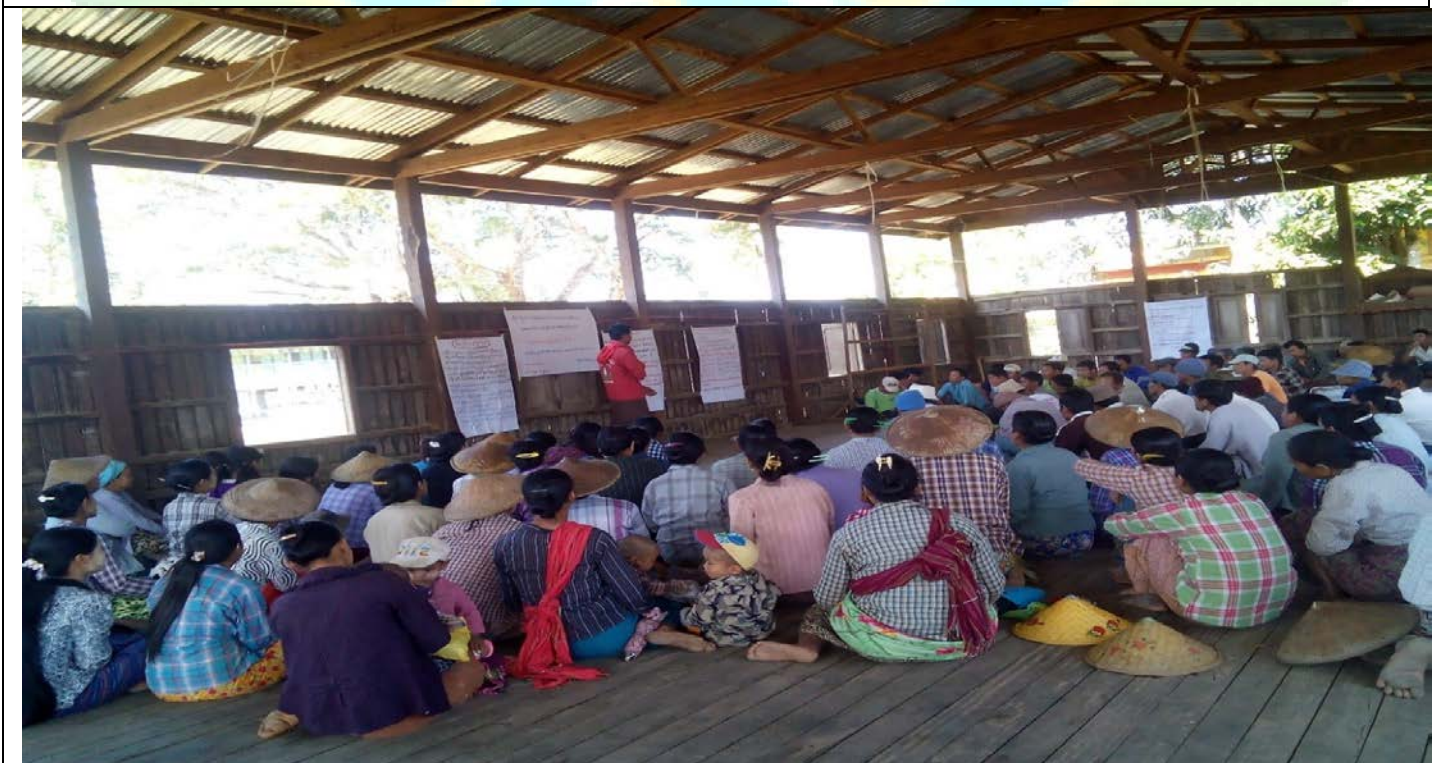
ထိခိုက်လွယ်အုပ်စုများ၏မှတ်တမ်းခါတ်ပုံ