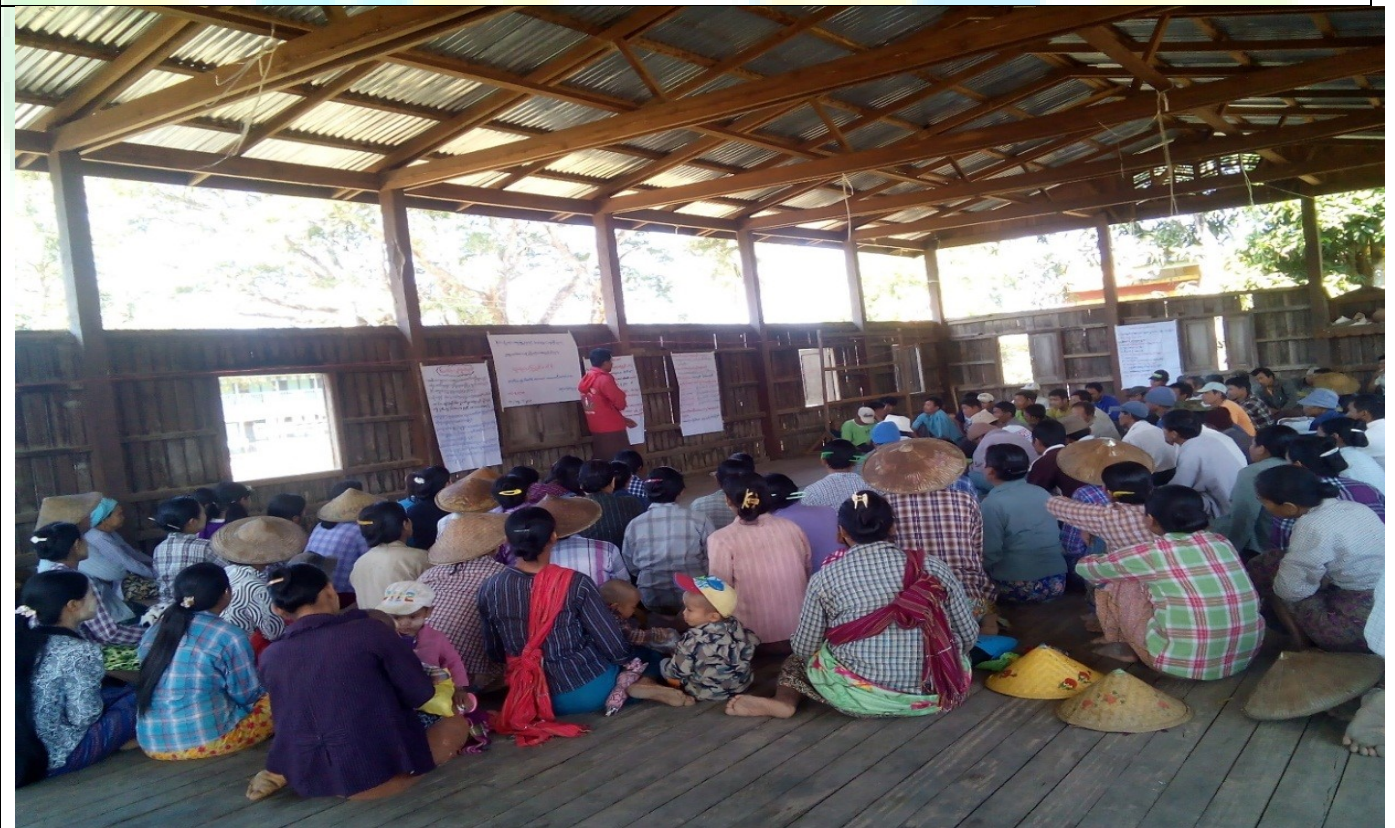
ဖွံ့ဖြိုးရေးအစီအစဉ်ရေးဆွဲခြင်းမှတ်တမ်းဓါတ်ပုံ