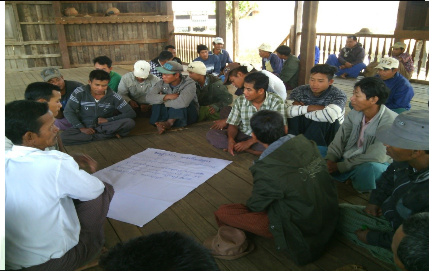
စေတနာ့ဝန်ထမ်းများရွေးချယ်ခြင်းမှတ်တမ်းခါတ်ပုံ