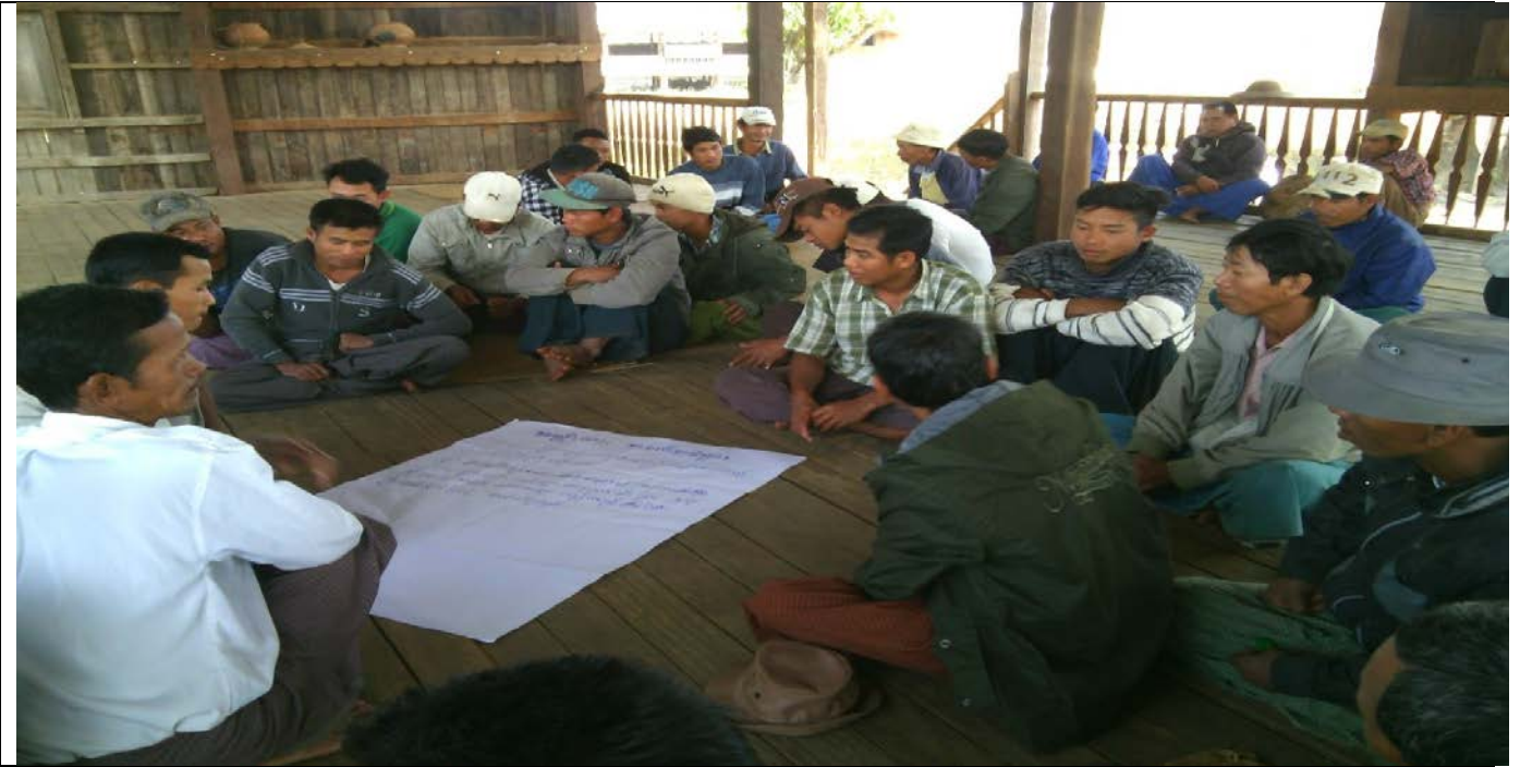
ဖွံ့ဖြိုးရေးအစီအစဉ်ရေးဆွဲခြင်းမှတ်တမ်းဓါတ်ပုံ