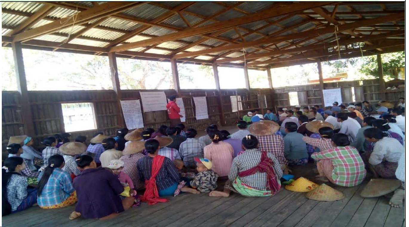
ကော်မတီရွေးချယ်ခြင်းမှတ်တမ်းခါတ်ပုံ