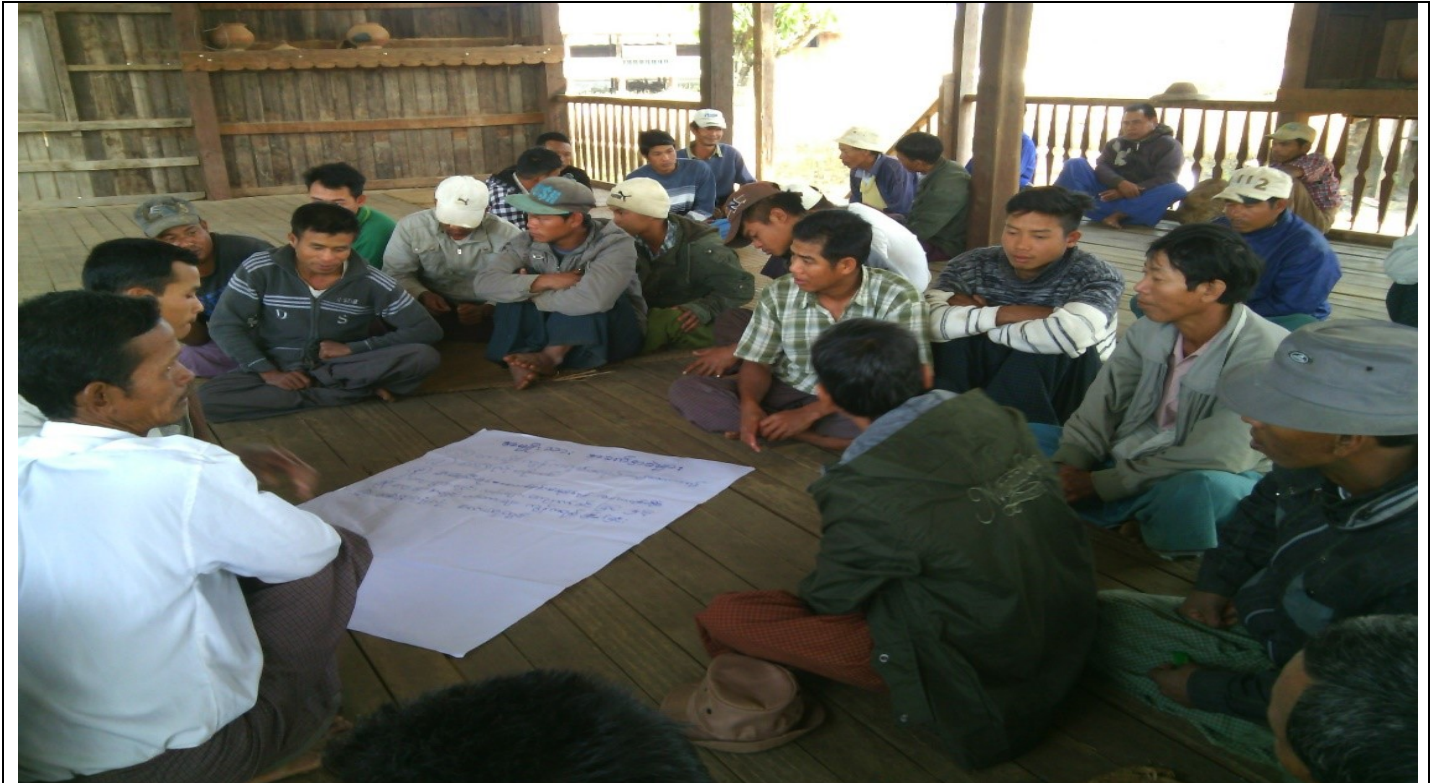
အမျိုးသားအုပ်စု၏မှတ်တမ်းခါတ်ပုံ