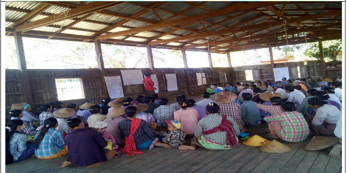
အမျိုးသမီးအုပ်စု၏မှတ်တမ်းခါတ်ပုံ