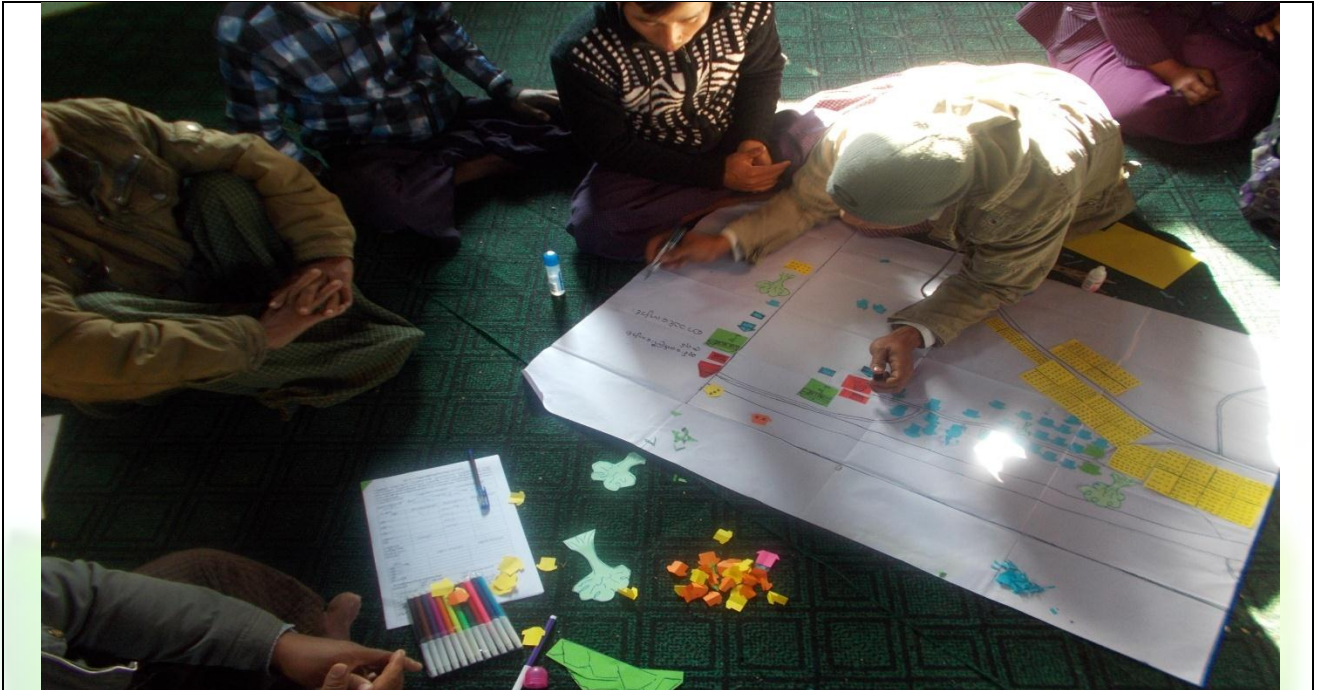
အမျိုးသားအုပ်စု၏ မှတ်တမ်းခါတ်ပုံ