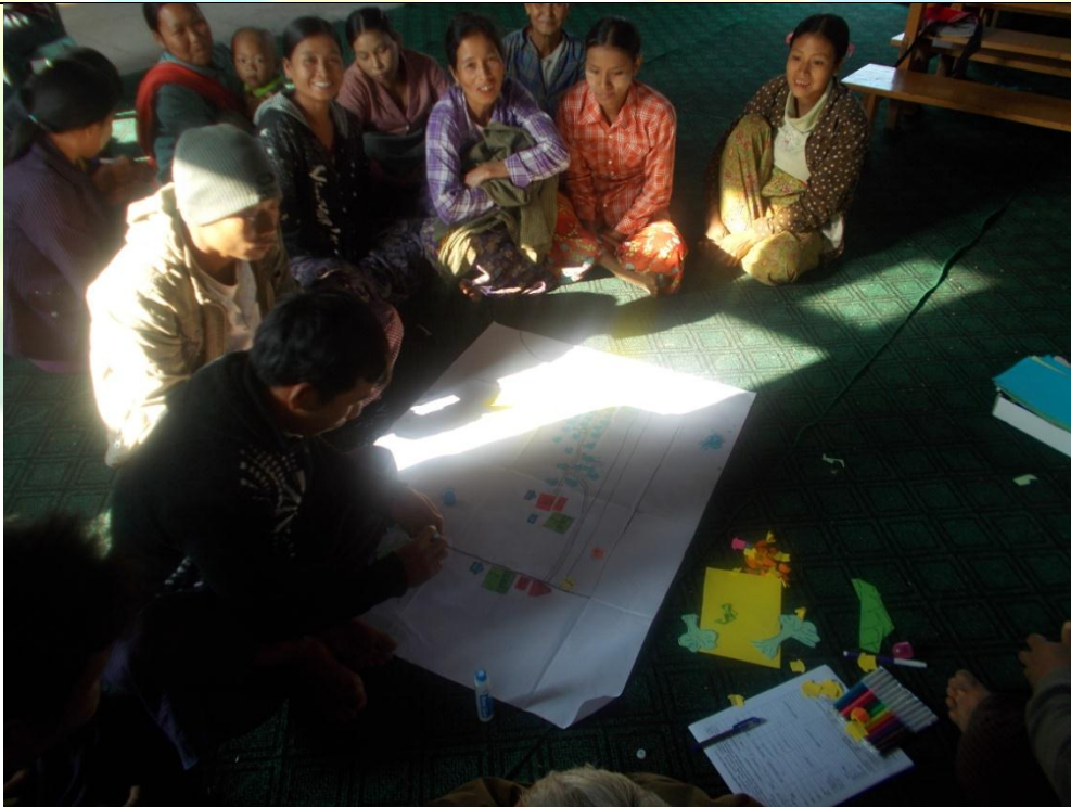
ဖွံ့ဖြိုးရေးအစီအစဉ်ရေးဆွဲခြင်း မှတ်တမ်းဓာတ်ပုံ