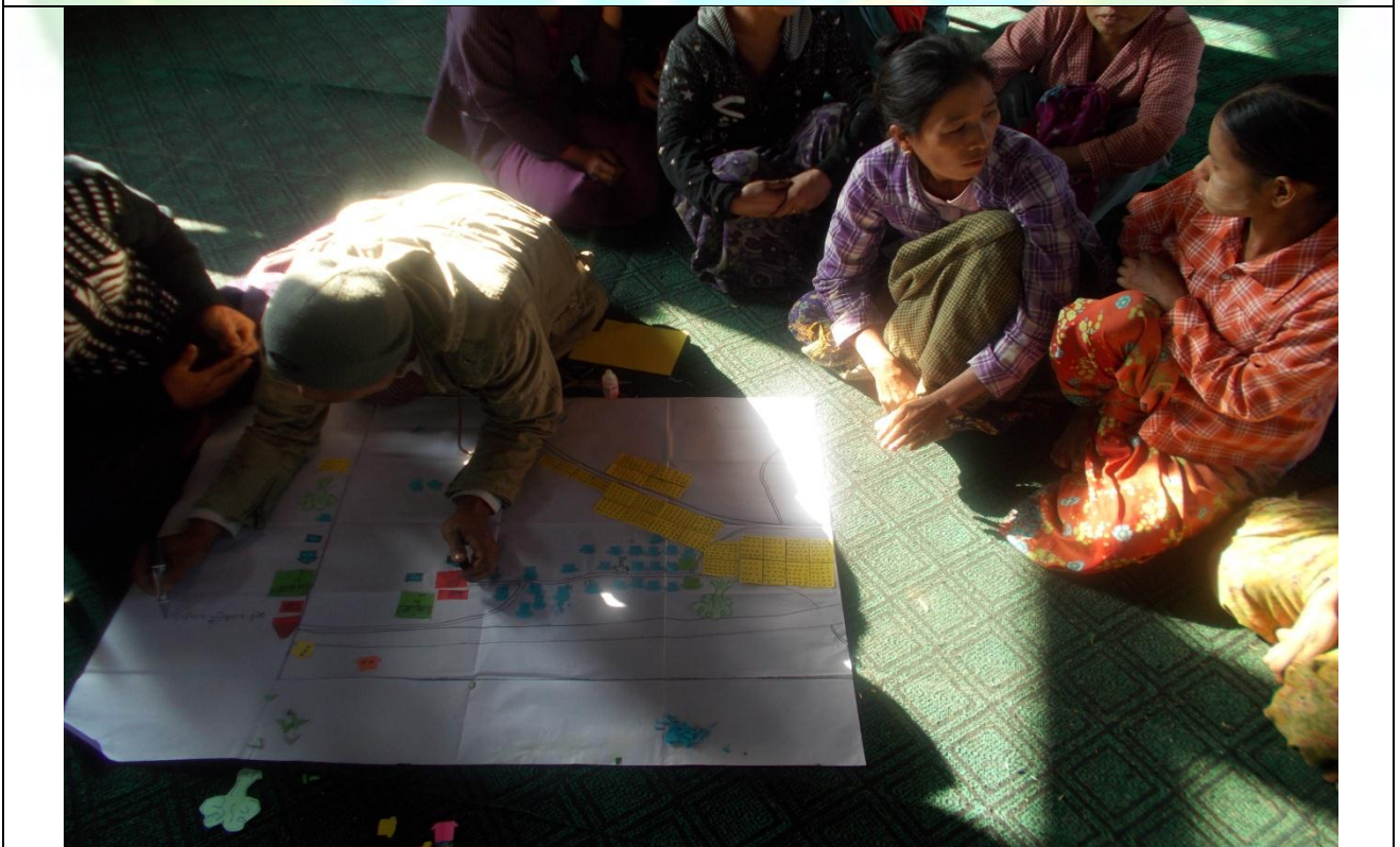
အမျိုးသမီးအုပ်စု၏ မှတ်တမ်းခါတ်ပုံ