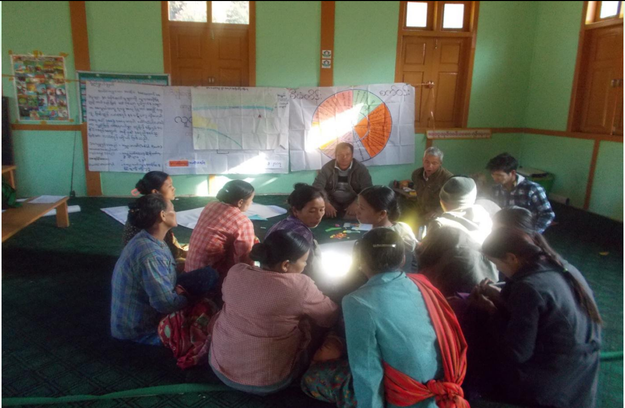
ထိခိုက်လွယ်အုပ်စုများ၏ မှတ်တမ်းခတ်ပုံ