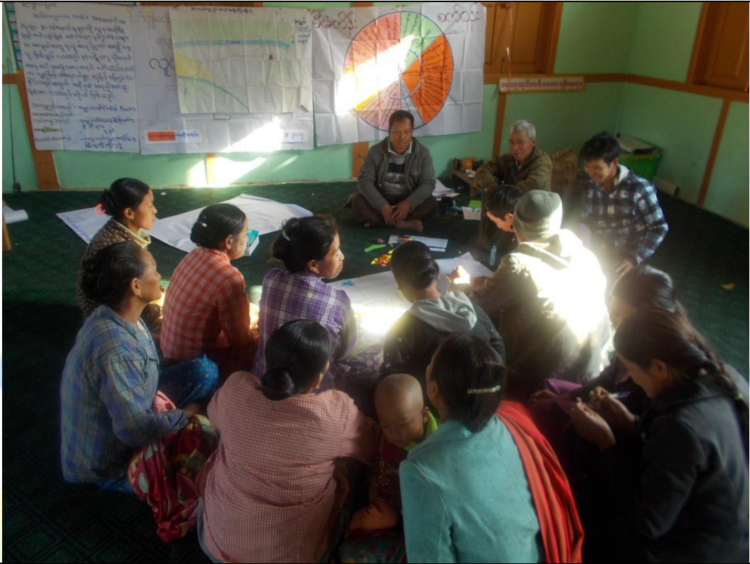
လူငယ်အုပ်စု၏ မှတ်တမ်းခတ်ပုံ