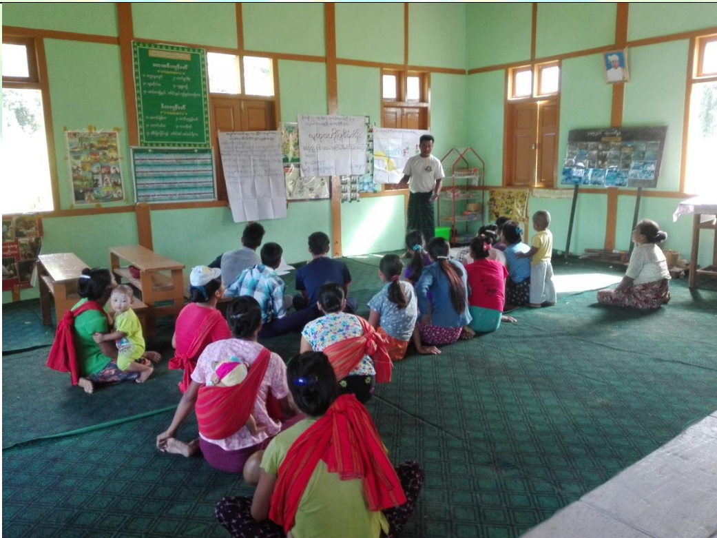
ကော်မတီရွေးချယ်ခြင်း မှတ်တမ်းဓာတ်ပုံ