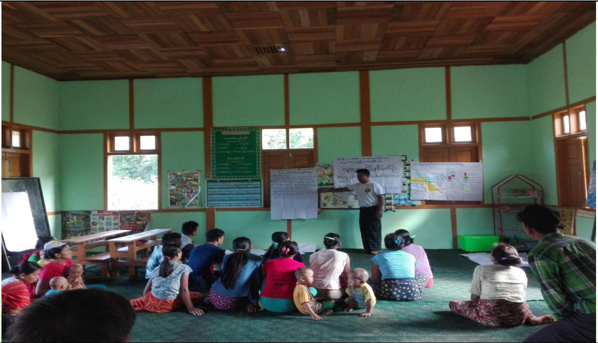
စေတနာ့ဝန်ထမ်းများ ရွေးချယ်ခြင်း မှတ်တမ်းဓာတ်ပုံ