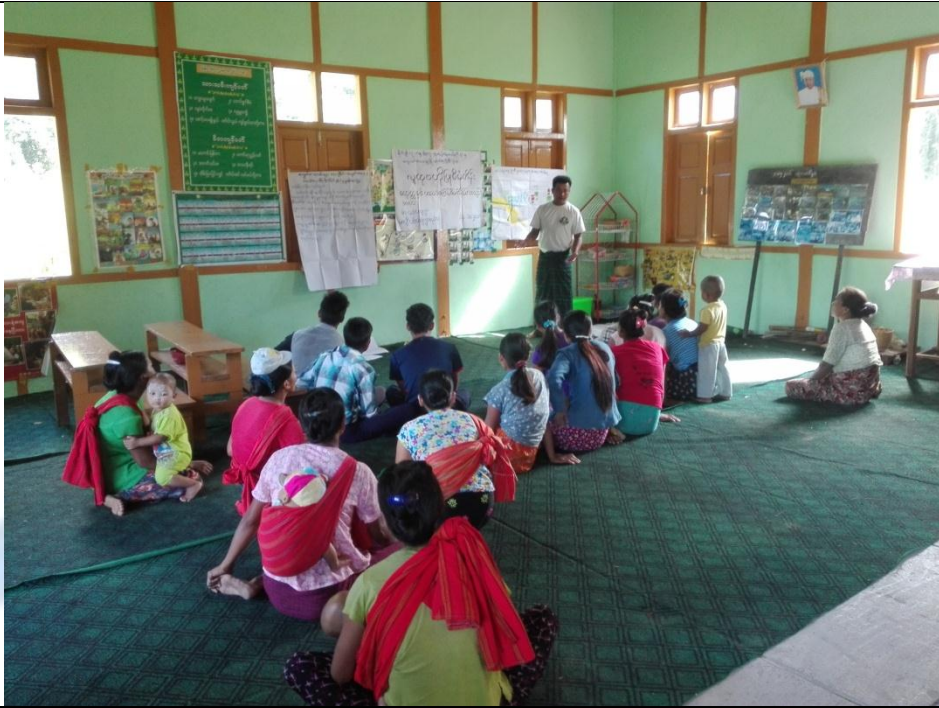
ဖွံ့ဖြိုးရေးအစီအစဉ်ရေးဆွဲခြင်း မှတ်တမ်းဓာတ်ပုံ