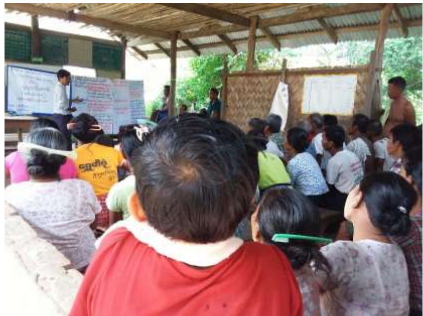
Village Development Plan (VDP)