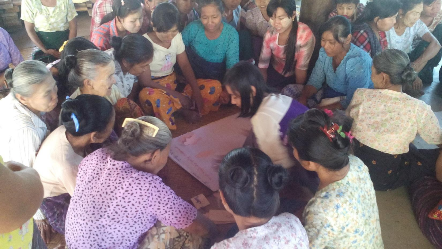
ကျေးရွာသူ၊ ကျေးရွာသားများအရင်းအမြစ် သုံးစွဲမှုနှင့် ထိန်းချုပ်မှုပြဇယားရေးဆွဲနေပုံ