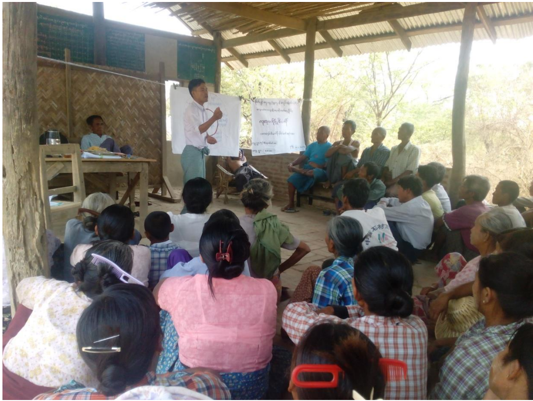
ကျေးရွာသူ၊ ကျေးရွာသားများကျေးရွာလူမှုရေးနှင့် အရင်းအမြစ်ပြုပြင်ရေးဆွဲနေစဉ်