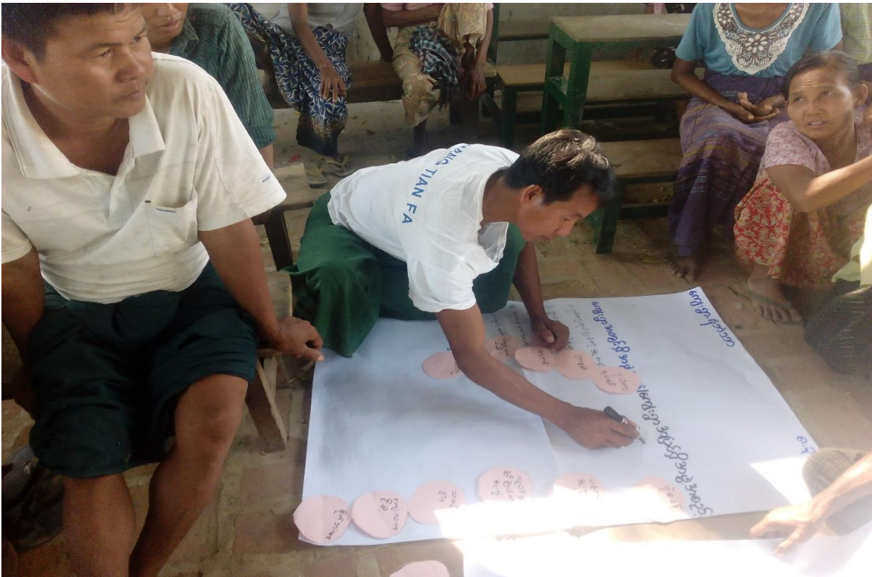
ကျေးရွာသူ၊ ကျေးရွာသားများအဖွဲ့အစည်းချိတ်ဆက်မှုပြ မြေပုံရေးဆွဲနေပုံ