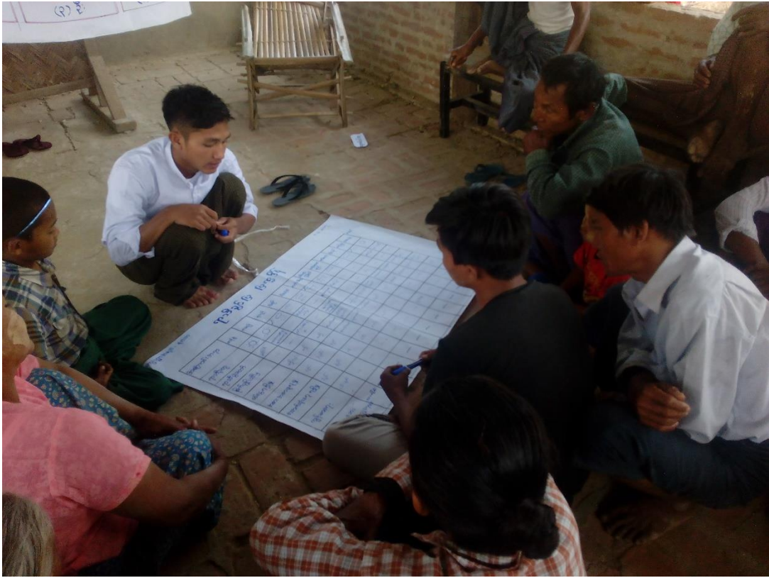
ကျေးရွာသူ၊ ကျေးရွာသားများရာသီခွင်ပြုပြင်ကွဲအိန်ရေးဆွဲနေပုံ