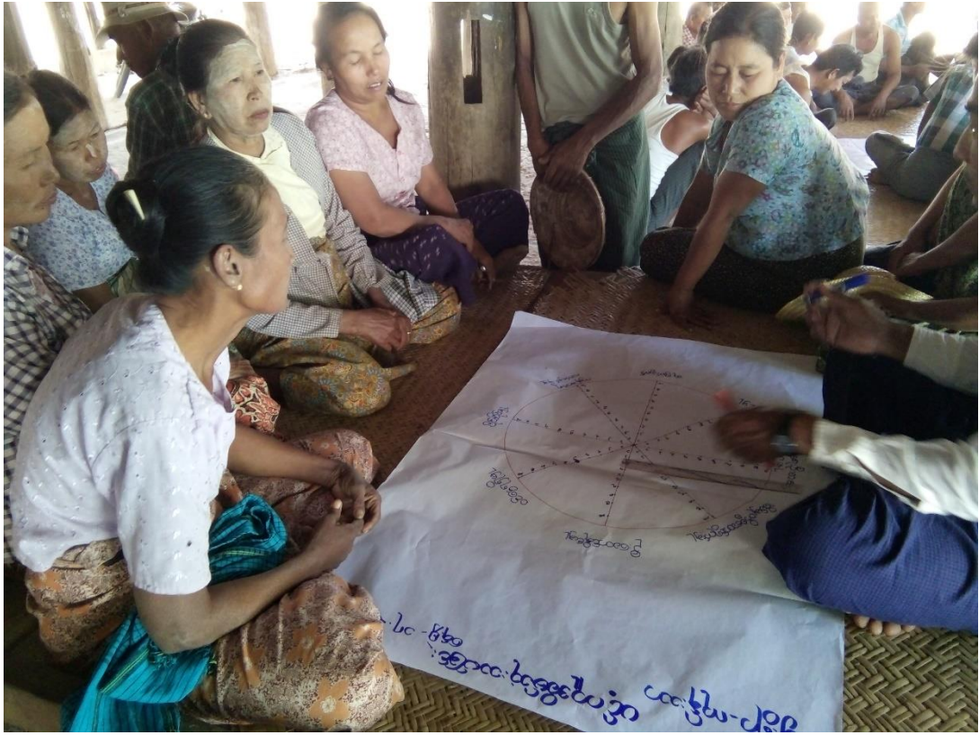
ကျေးရွာသူ၊ ကျေးရွာသားများပင့်ကူအိမ်သုံးသပ်ချက်ပြဇယားရေးဆွဲနေပုံ