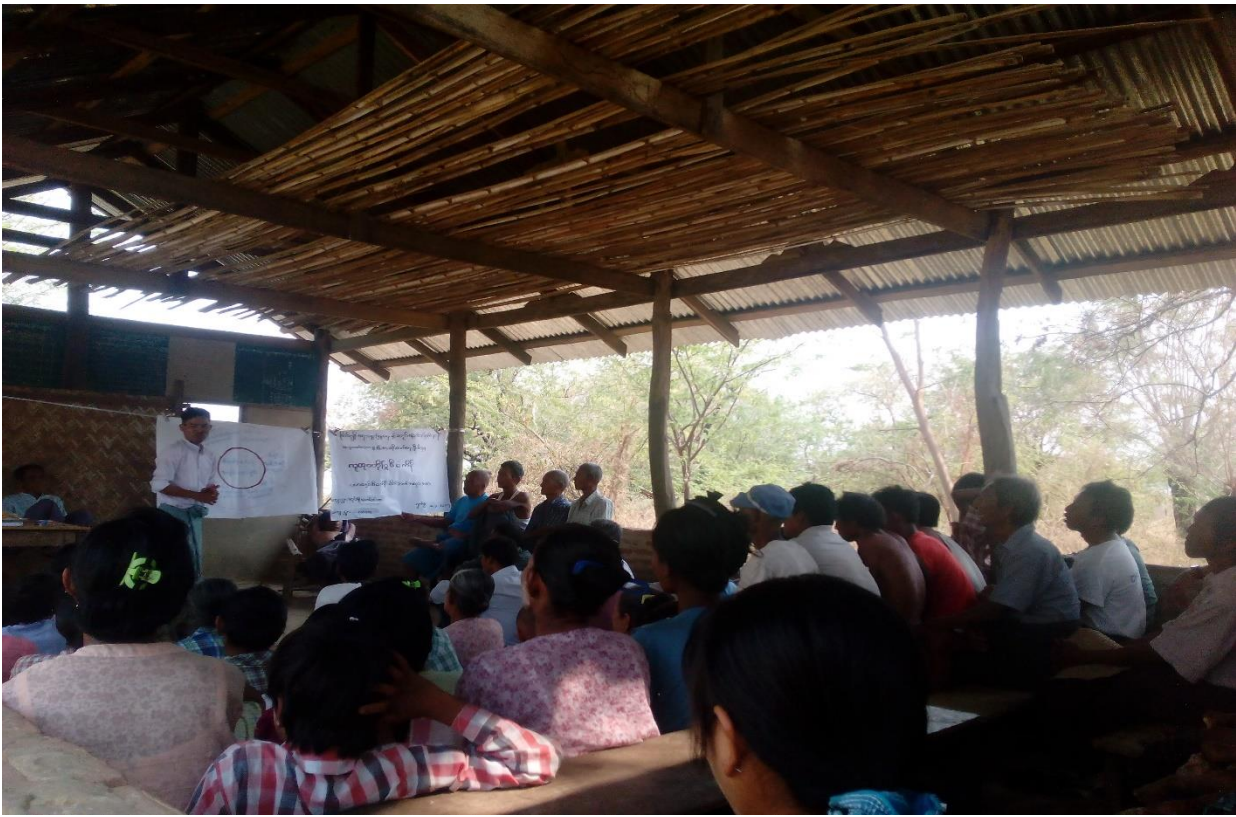
ကျေးရွာသူ၊ ကျေးရွာသားများဥစ္စာနေကြွယ်ဝမှုပြယောင်းရေးဆွဲနေပုံ