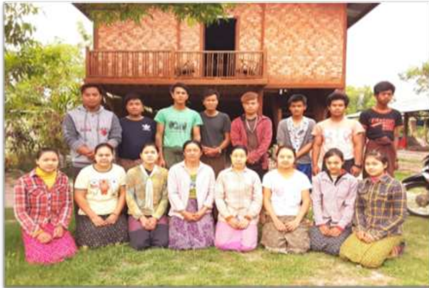
ကျေးရွာဖွံ့ဖြိုးရေးအစီအစဉ် Village Development Plan (VDP) မြို့ဟောင်းကျေးရွာ၊ နောင်မွန်ကျေးရွာအုပ်စု