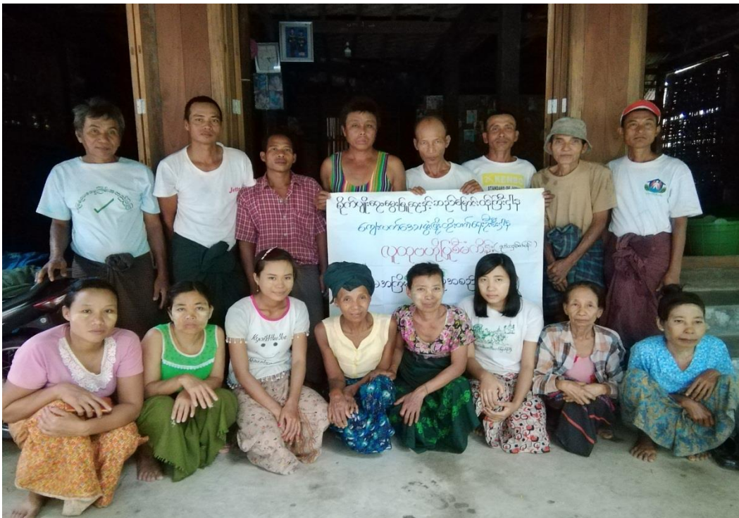
ပွတ်ကုန်း ကျေးရွာအုပ်စုမြေရိက္ခင်းကျေးရွာ ၂၀၁၉-ခုနှစ်

National Community Driven Development Project လူထုဗဟိုပြုစီမံကိန်း(ဒုတိယနှစ်) အင်္ဂပူမြို့နယ် ၊ ဧရာဝတီတိုင်းဒေသကြီး ကျေးရွာဖွံ့ဖြိုးရေးအစီအစဉ်