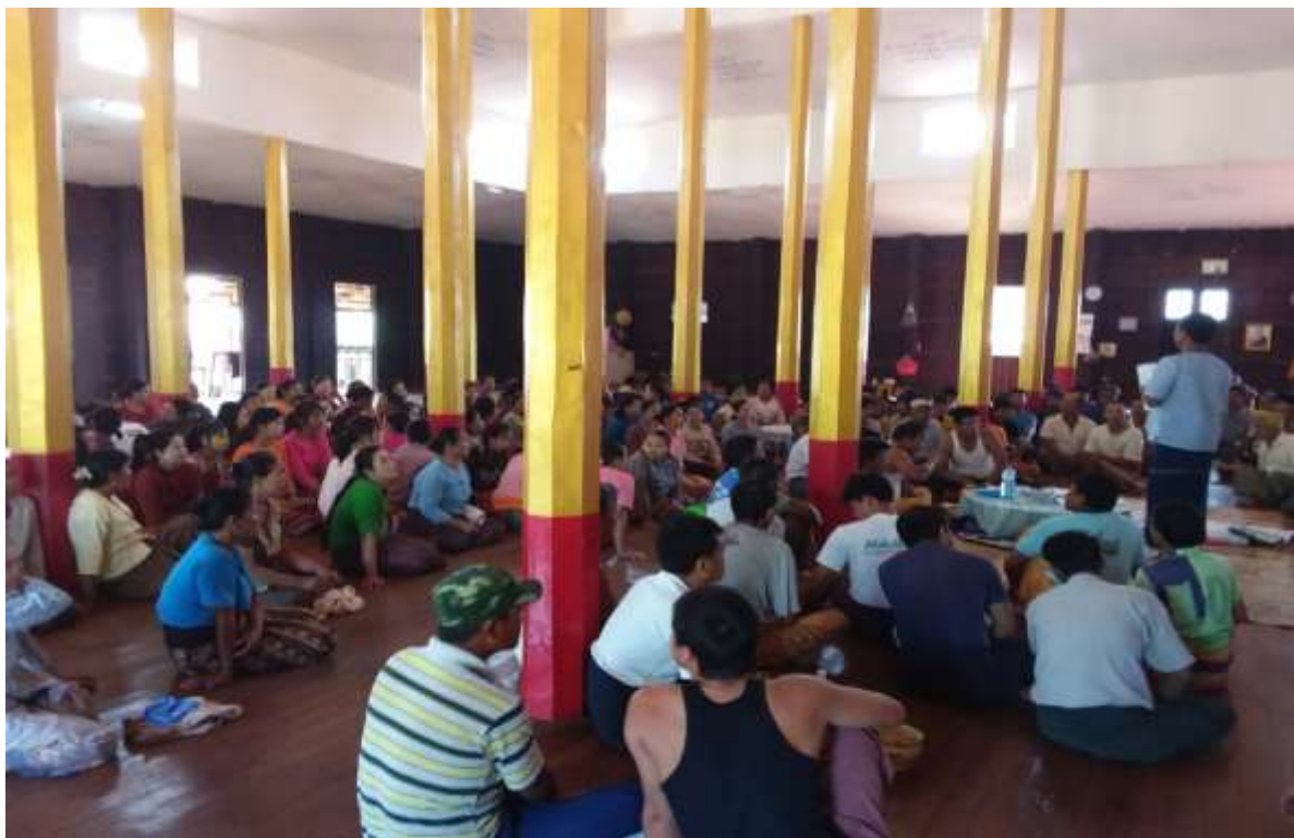
၇။ ကော်မတီဝင်များရွေးချယ်ခြင်းနှင့်ကျေးရွာဖွံ့ဖြိုးရေးအစီအစဉ်ဆောင်ရွက်မှုမှတ်တမ်းခါတ်ပုံများ