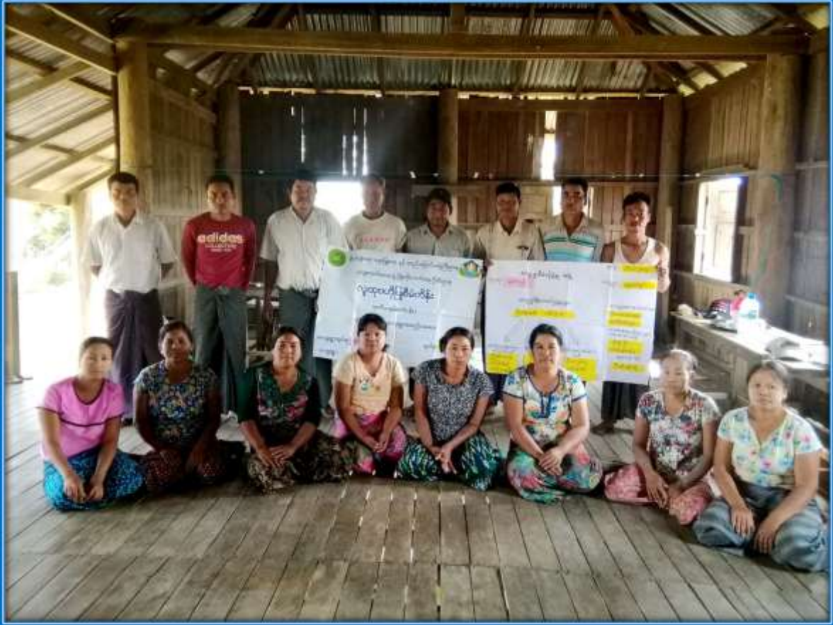
၇။ ကော်မတီဝင်များရွေးချယ်ခြင်းနှင့် ကျေးရွာဖွံ့ဖြိုးရေးအစီအစဉ်ဆောင်ရွက်မှု မှတ်တမ်းဓာတ်ပုံများ