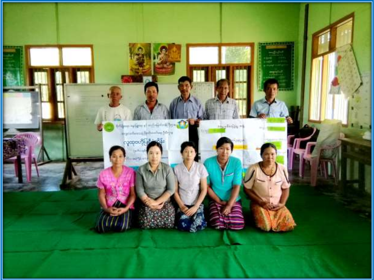
၇။ ကော်မတီဝင်များရွေးချယ်ခြင်းနှင့် ကျေးရွာဖွံ့ဖြိုးရေးအစီအစဉ်ဆောင်ရွက်မှု မှတ်တမ်းဓါတ်ပုံများ