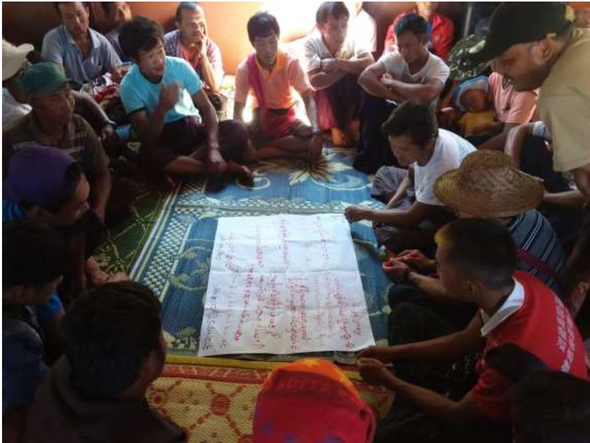
၇။ ကော်မတီဝင်များရွေးချယ်ခြင်းနှင့် ကျေးရွာဖွံ့ဖြိုးရေးအစီအစဉ် ဆောင်ရွက်မှု မှတ်တမ်း ဓါတ်ပုံများ