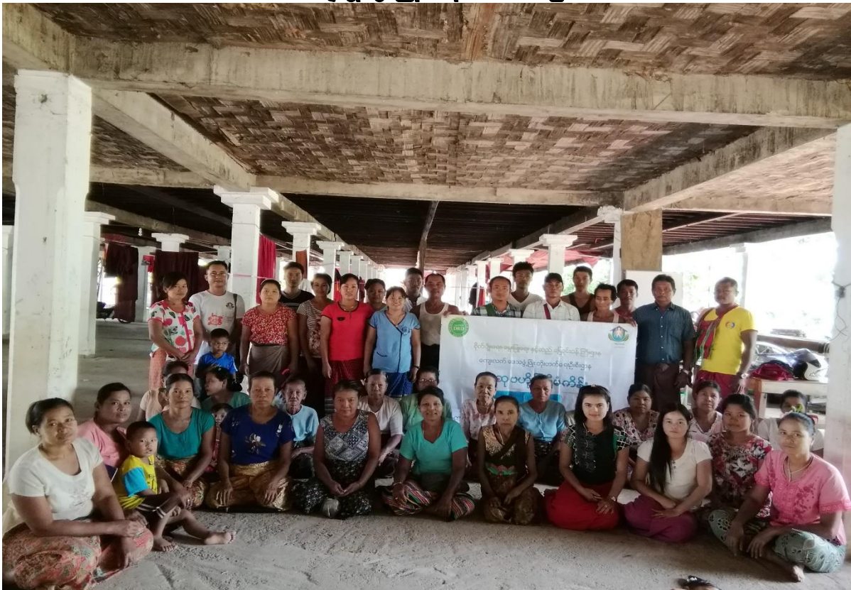
နဘူးနှစ်ခြားကျေးရွာအုပ်စု၊ မွန်စုကျေးရွာ ၂၀၁၉ - ခုနှစ်

လူထုဗဟိုပြုစီမံကိန်း ကျောက်ရိတ်မြို့နယ်၊ ကရင်ပြည်နယ် ကျေးရွာဖွံ့ဖြိုးရေးအစီအစဉ်