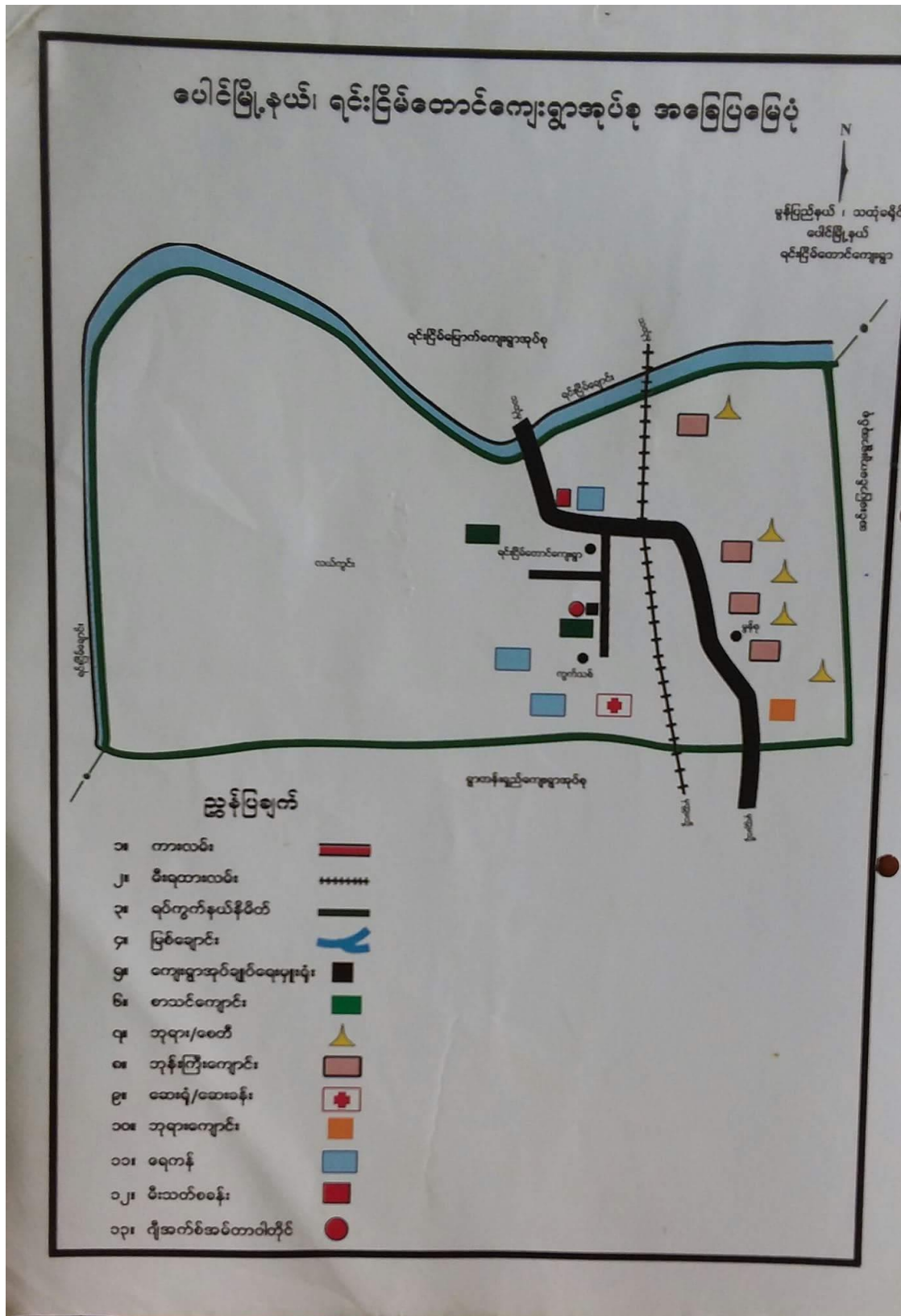
မွန်စုကျေးရွာ၊ရင်းငြိမ်တောင်ကျေးရွာအုပ်စု၊ပေါင်မြို့နယ်။