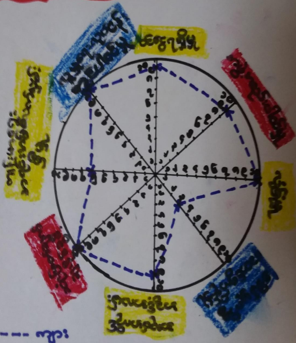
မွန်စုကျေးရွာရင်းငြိမ်တောင်ကျေးရွာအုပ်စုပေါင်မြို့နယ်။