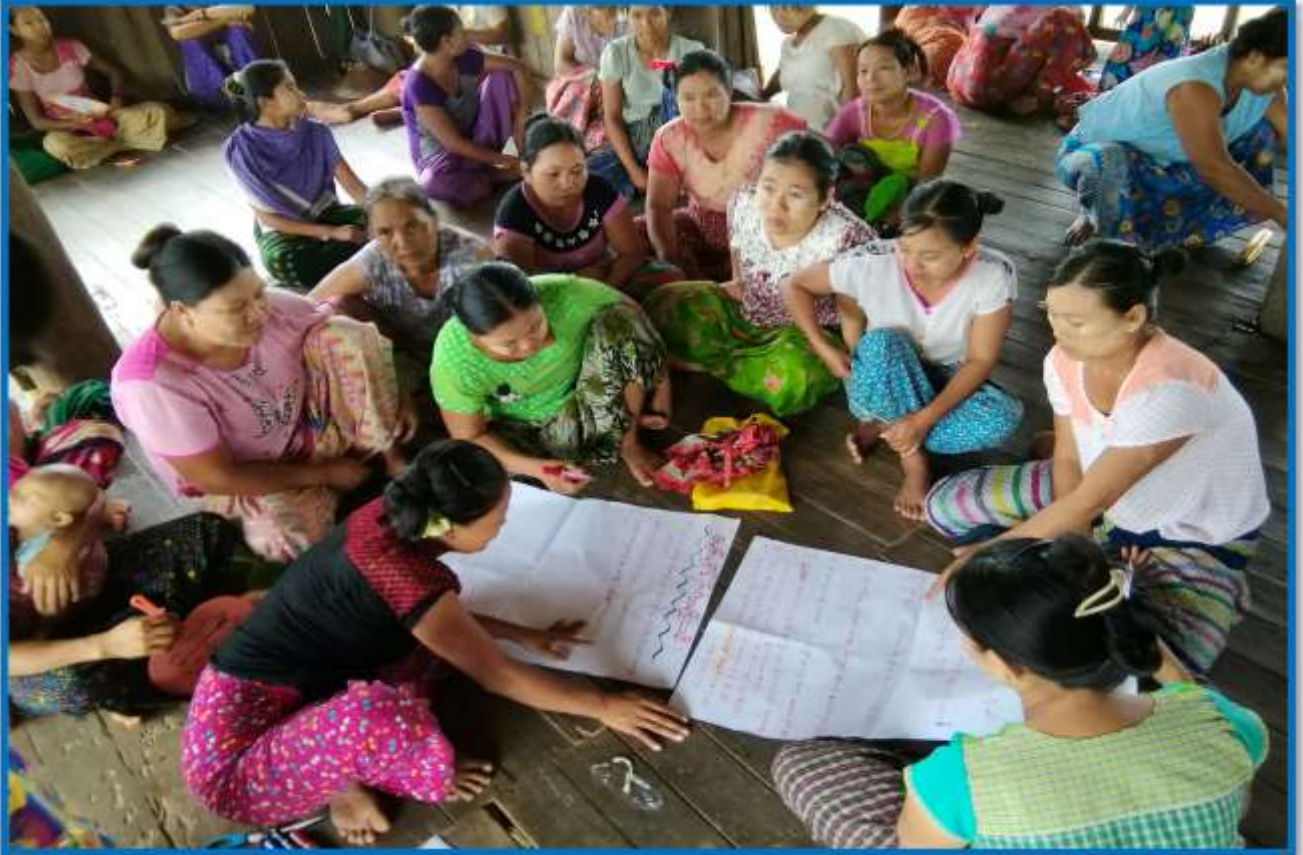
၇။ ကော်မတီဝင်များရွေးချယ်ခြင်းနှင့် ကျေးရွာဖွံ့ဖြိုးရေးအစီအစဉ်ဆောင်ရွက်မှု မှတ်တမ်းဓါတ်ပုံများ