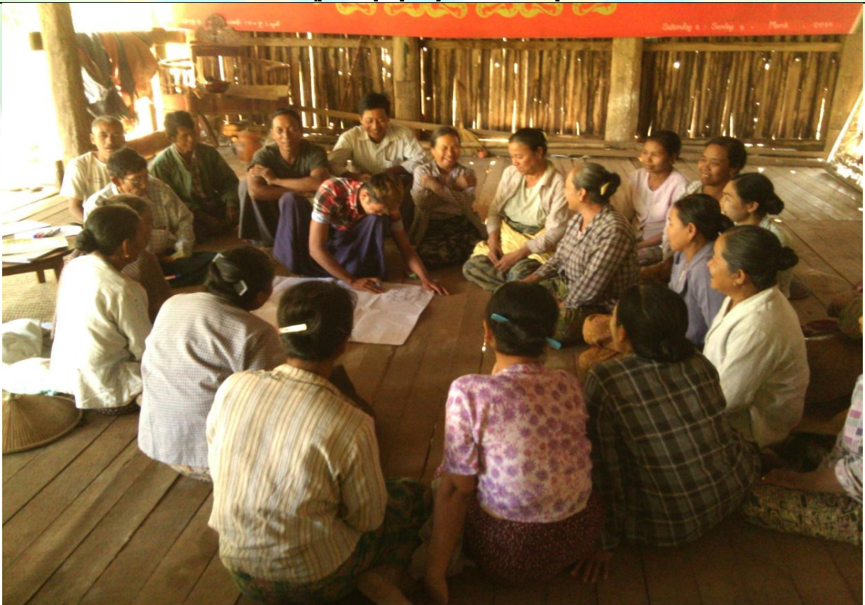
ထိခိုက်လွယ်အုပ်စုများ၏ မှတ်တမ်းခါတ်ပုံ