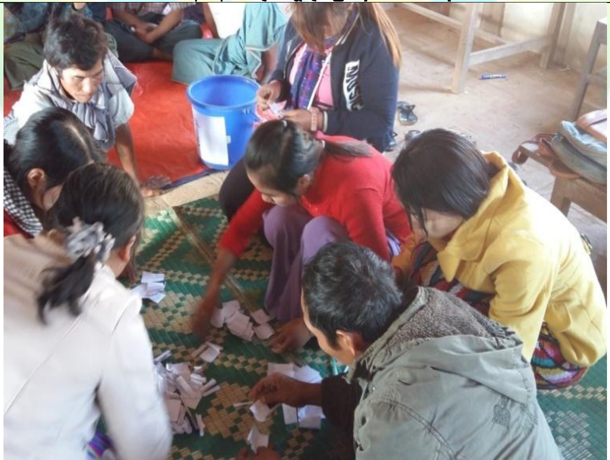
ကော်မတီရွေးချယ်ခြင်း မှတ်တမ်းခါတ်ပုံ