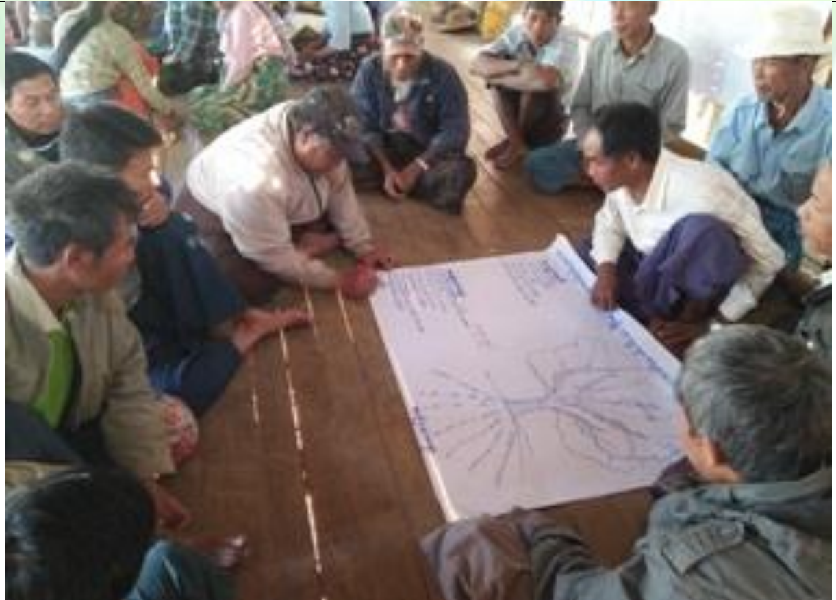
ဖွံ့ဖြိုးရေးအစီအစဉ်ရေးဆွဲခြင်း မှတ်တမ်းဓါတ်ပုံ