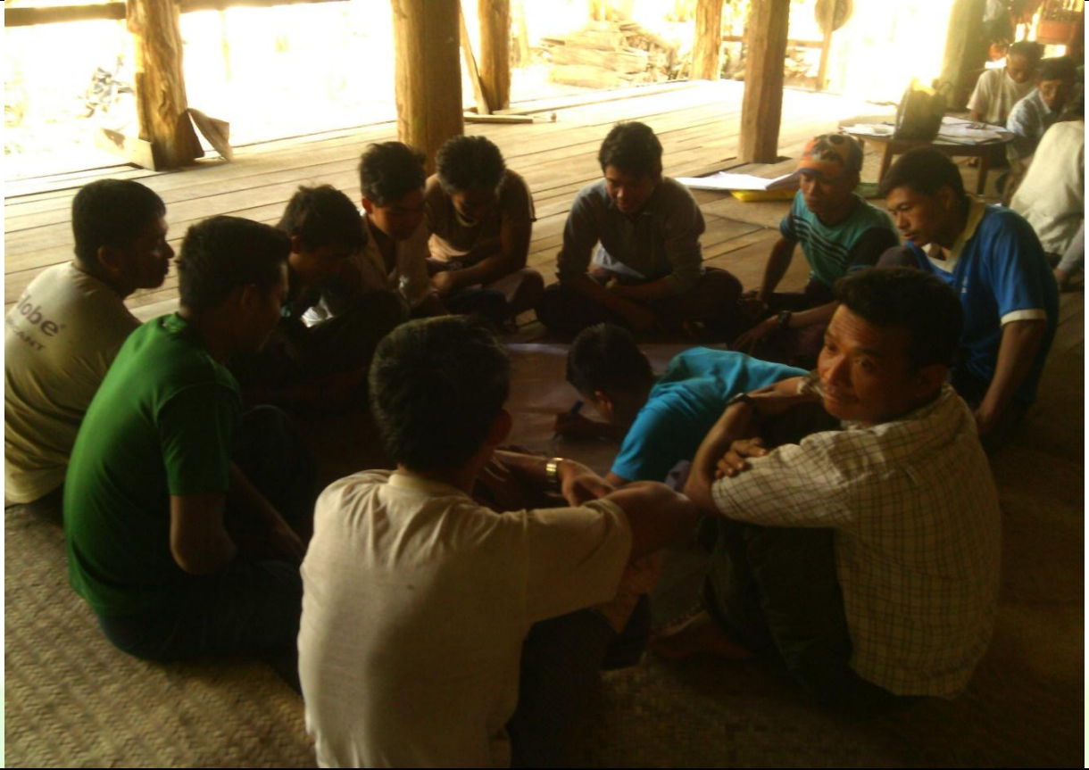
လူငယ်အုပ်စု၏ မှတ်တမ်းခါတ်ပုံ