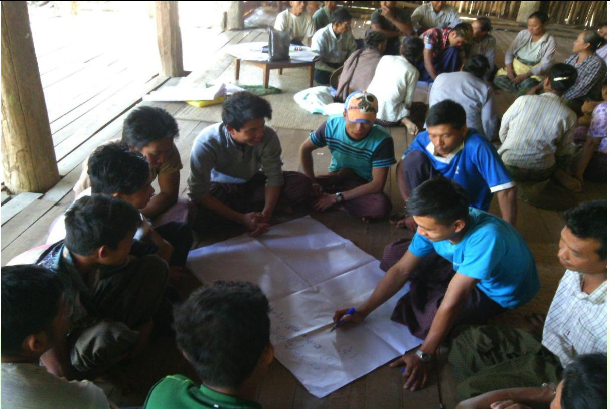
အမျိုးသားအုပ်စု၏ မှတ်တမ်းခါတ်ပုံ