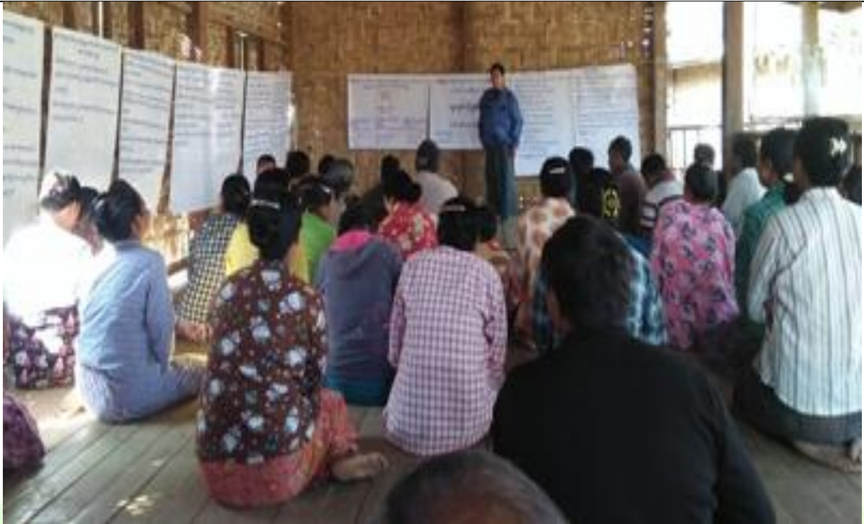
စေတနာ့ဝန်ထမ်းများ ရွေးချယ်ခြင်း မှတ်တမ်းခါတ်ပုံ