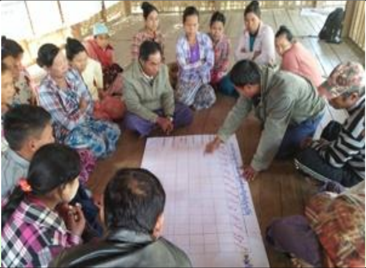
ဖွံ့ဖြိုးရေးအစီအစဉ်ရေးဆွဲခြင်း မှတ်တမ်းဓါတ်ပုံ