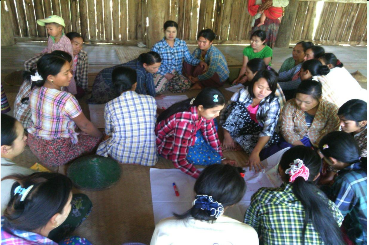
အမျိုးသမီးအုပ်စု၏ မှတ်တမ်းခါတ်ပုံ