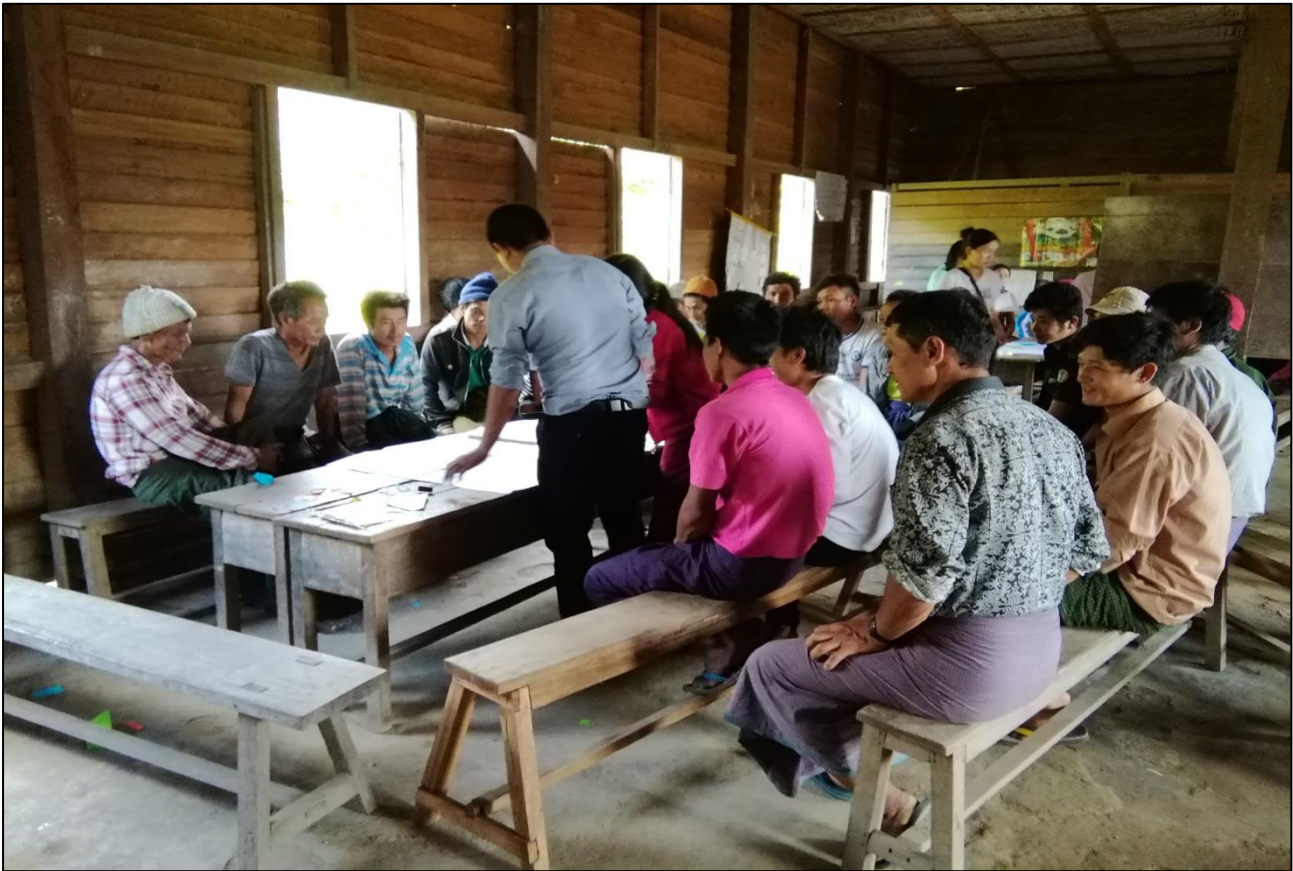
၇။ ကော်မတီဝင်များရွေးချယ်ခြင်းနှင့် ကျေးရွာဖွံ့ဖြိုးရေးအစီအစဉ် ဆောင်ရွက်မှု မှတ်တမ်းခတ်ပုံများ