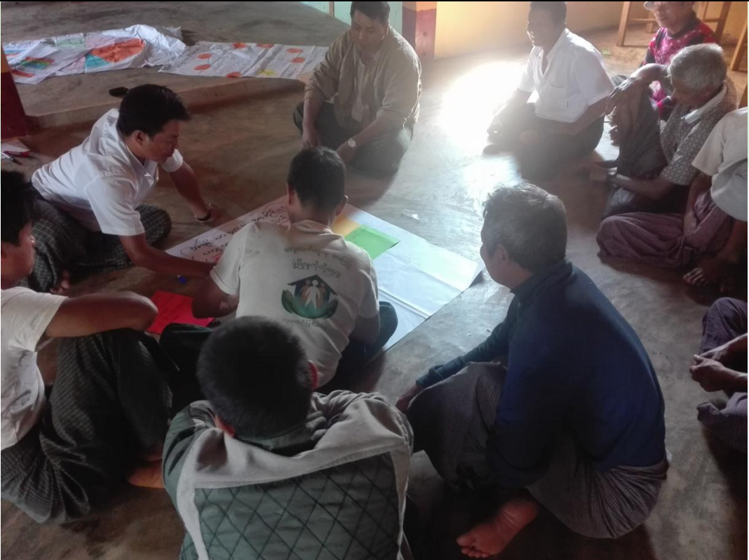
လူငယ်အုပ်စု၏ မှတ်တမ်းခတ်ပုံ