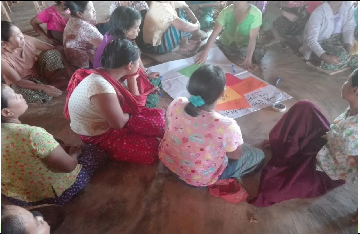
ထိခိုက်လွယ်အုပ်စုများ၏ မှတ်တမ်းခတ်ပုံ