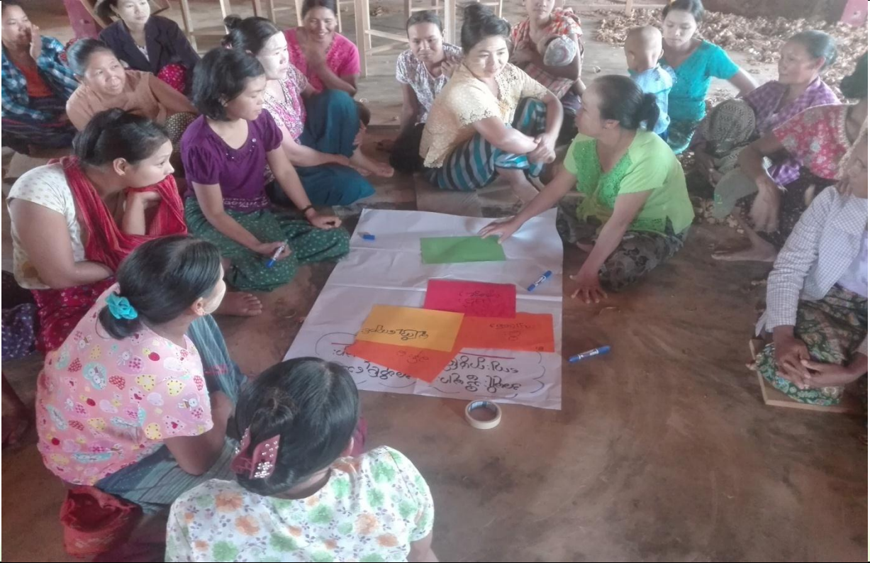
အမျိုးသမီးအုပ်စု၏ မှတ်တမ်းခတ်ပုံ