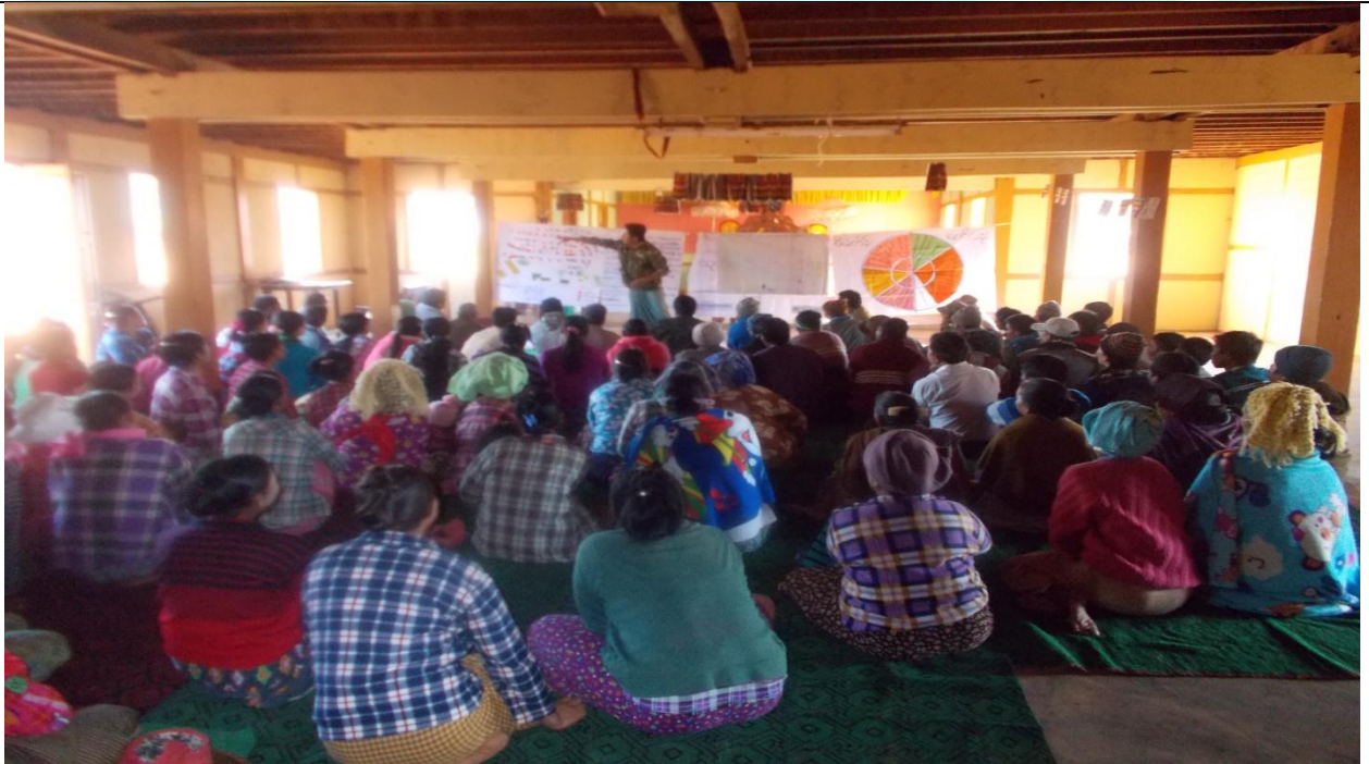
စေတနာ့ဝန်ထမ်းများ ရွေးချယ်ခြင်း မှတ်တမ်းခတ်ပုံ