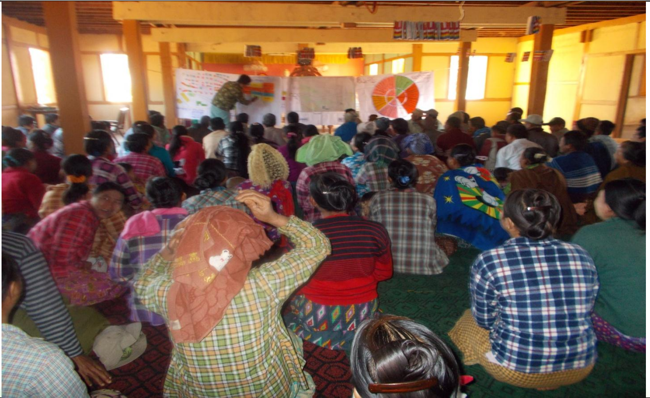
ကော်မတီရွေးချယ်ခြင်း မှတ်တမ်းဓာတ်ပုံ