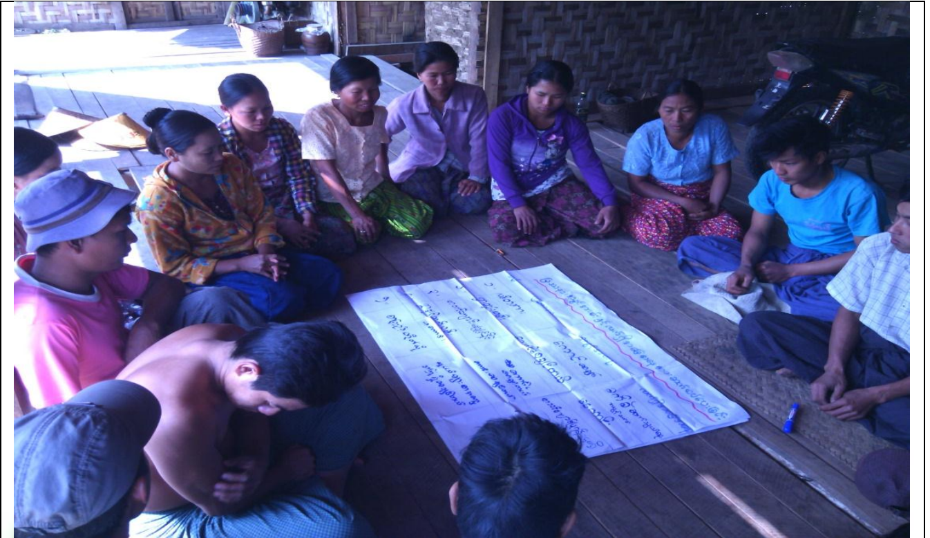
လူငယ်အုပ်စု၏ မှတ်တမ်းခါတ်ပုံ