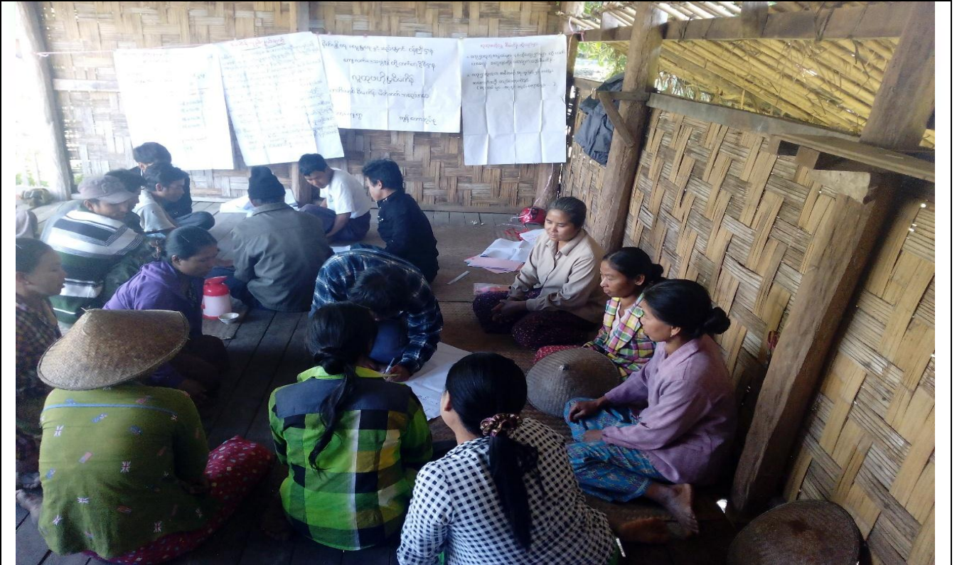
အမျိုးသမီးအုပ်စု၏ မှတ်တမ်းခါတ်ပုံ