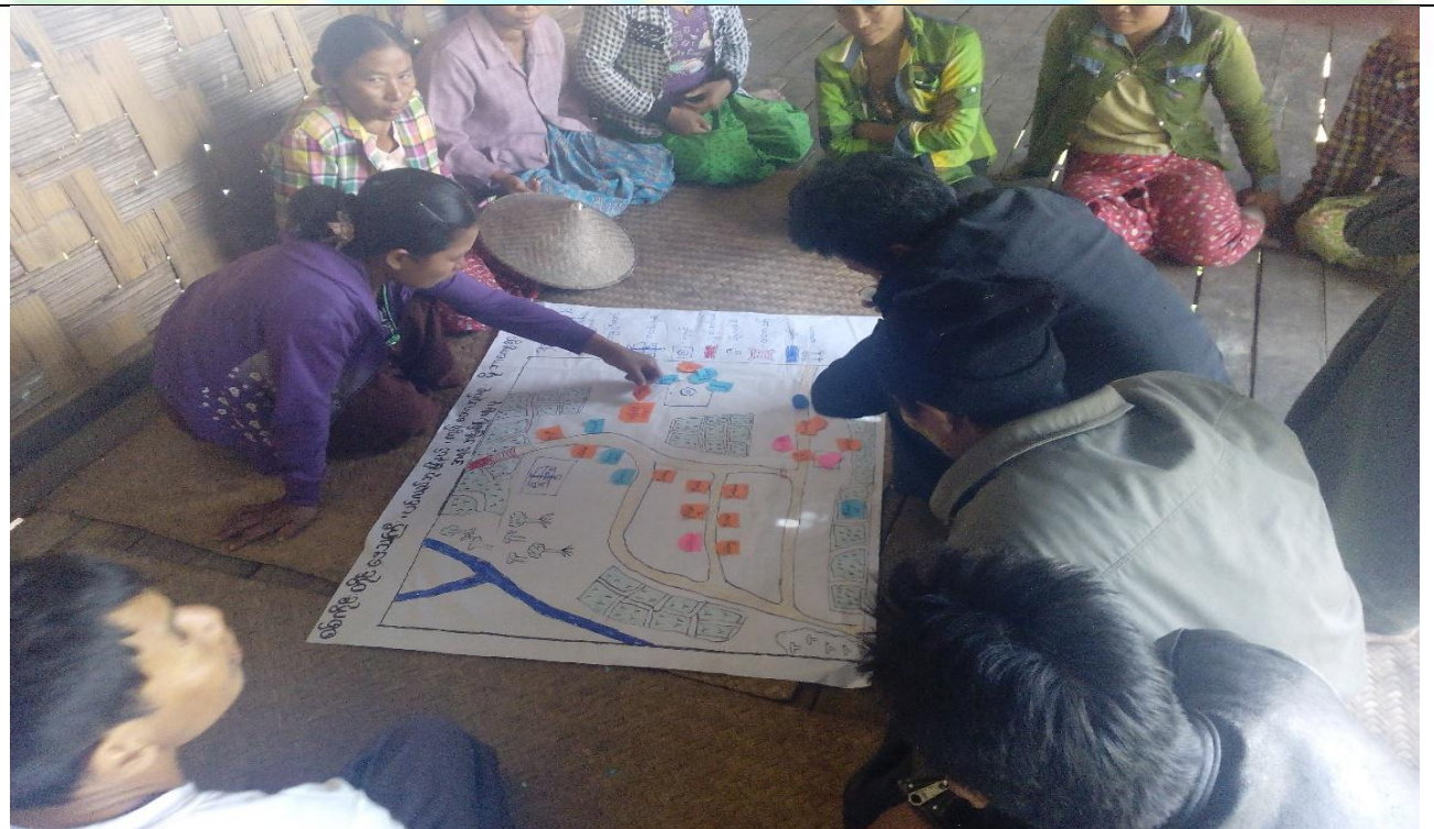
ဖွံ့ဖြိုးရေးအစီအစဉ်ရေးဆွဲခြင်း မှတ်တမ်းဓာတ်ပုံ