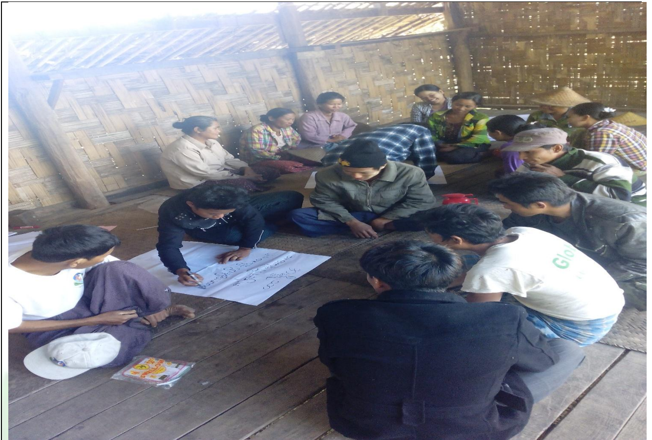
ဖွံ့ဖြိုးရေးအစီအစဉ်ရေးဆွဲခြင်း မှတ်တမ်းဓာတ်ပုံ