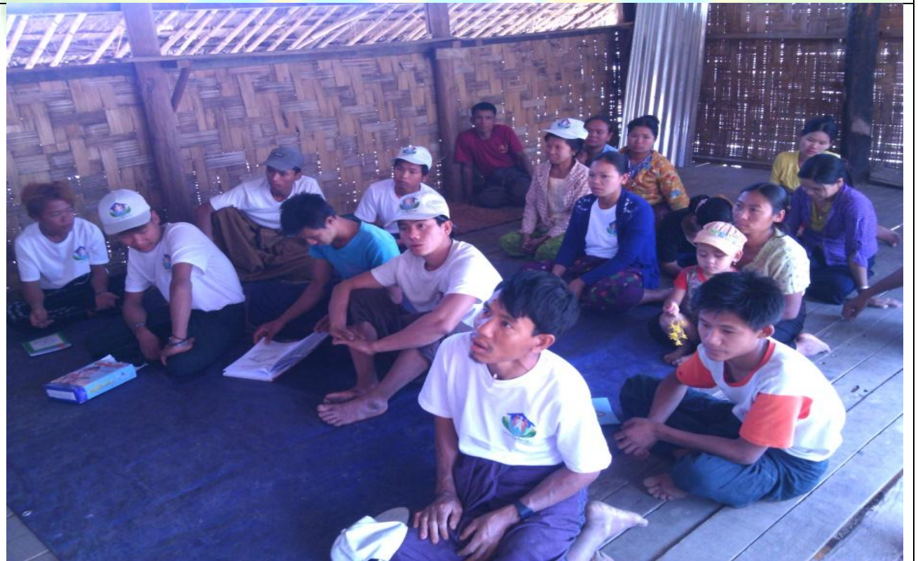
ကော်မတီရွေးချယ်ခြင်း မှတ်တမ်းဓာတ်ပုံ