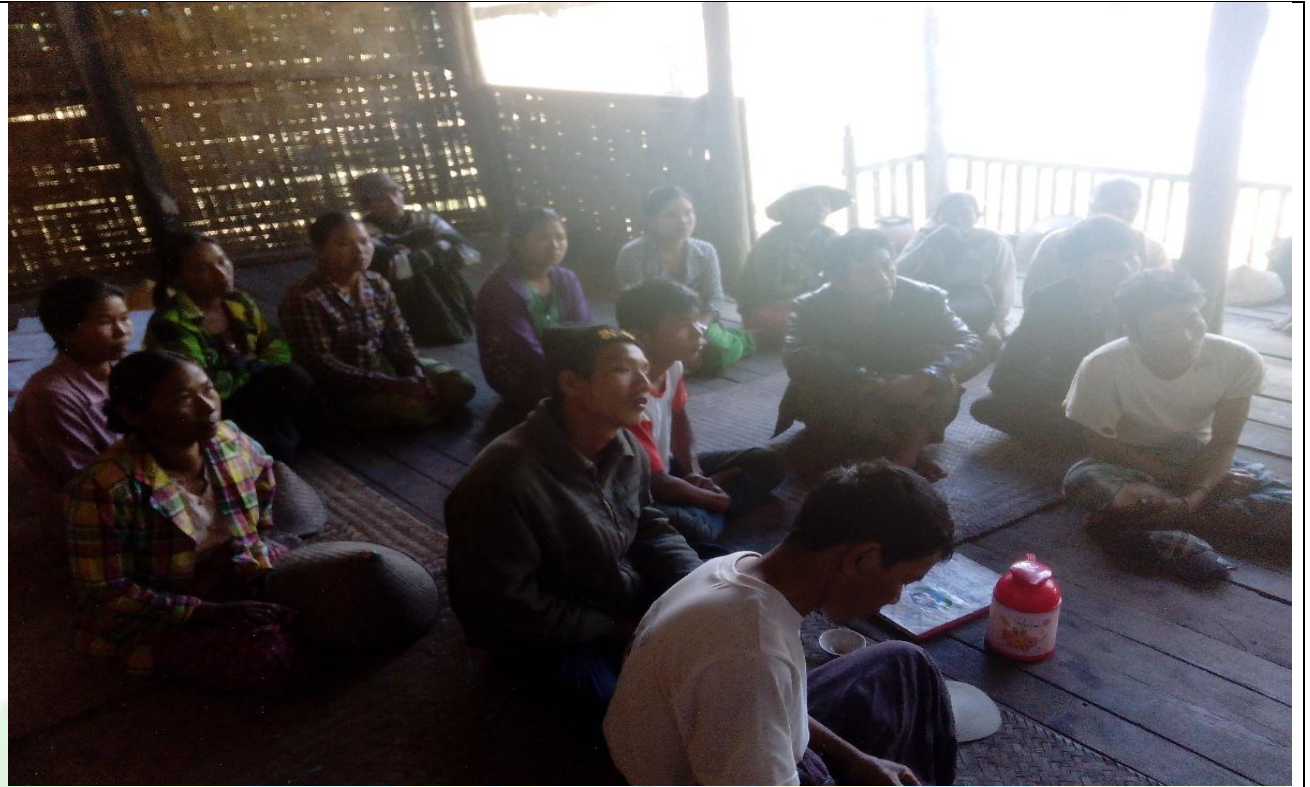
စေတနာ့ဝန်ထမ်းများ ရွေးချယ်ခြင်း မှတ်တမ်းဓာတ်ပုံ