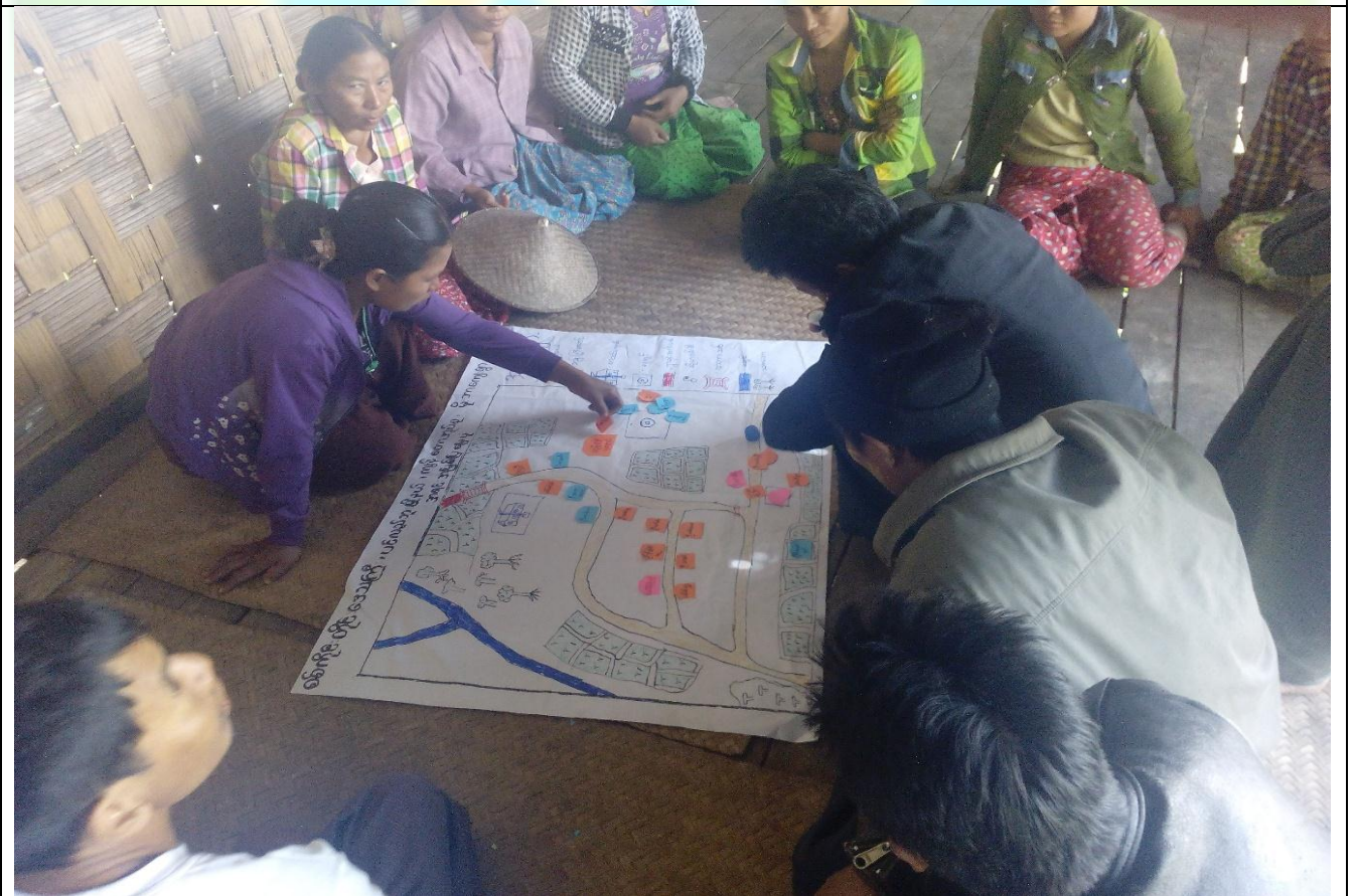
ထိခိုက်လွယ်အုပ်စုများ၏ မှတ်တမ်းခါတ်ပုံ