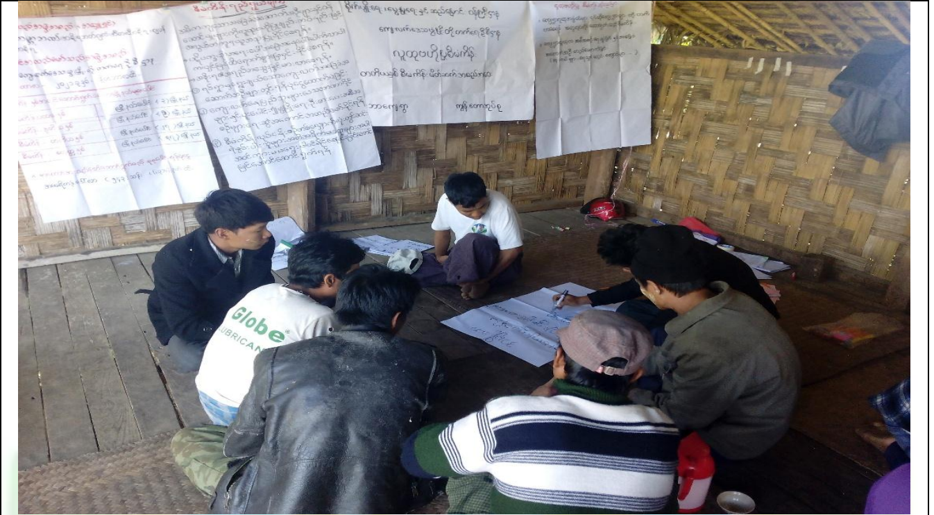
အမျိုးသားအုပ်စု၏ မှတ်တမ်းခါတ်ပုံ