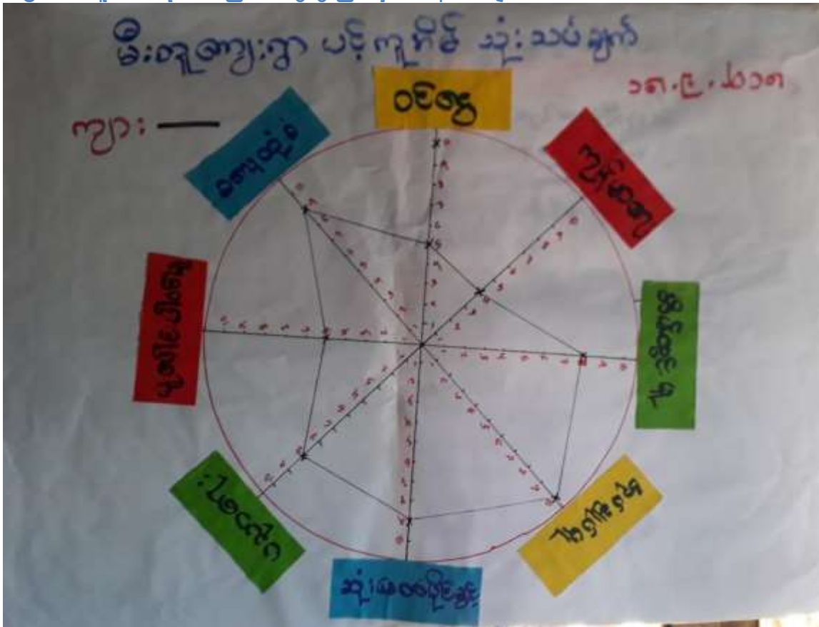
၆.၅။ ပဋိကူအိမ်သုံးသပ်ခြင်းဆွေးနွေးခြင်းနှင့်ဆန်းစစ်ချက်