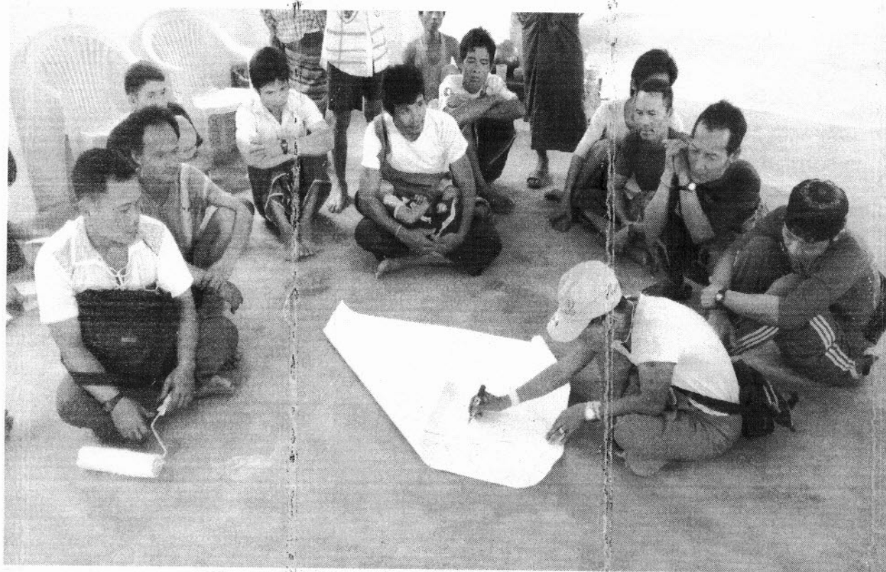
ကော်မတီဝင်များရွေးချယ်ခြင်းနှင့်ကျေးရွာဖွံ့ဖြိုးရေးအစီအစဉ်ဆောင်ရွက်မှုမှတ်တမ်းဓာတ်ပုံများ