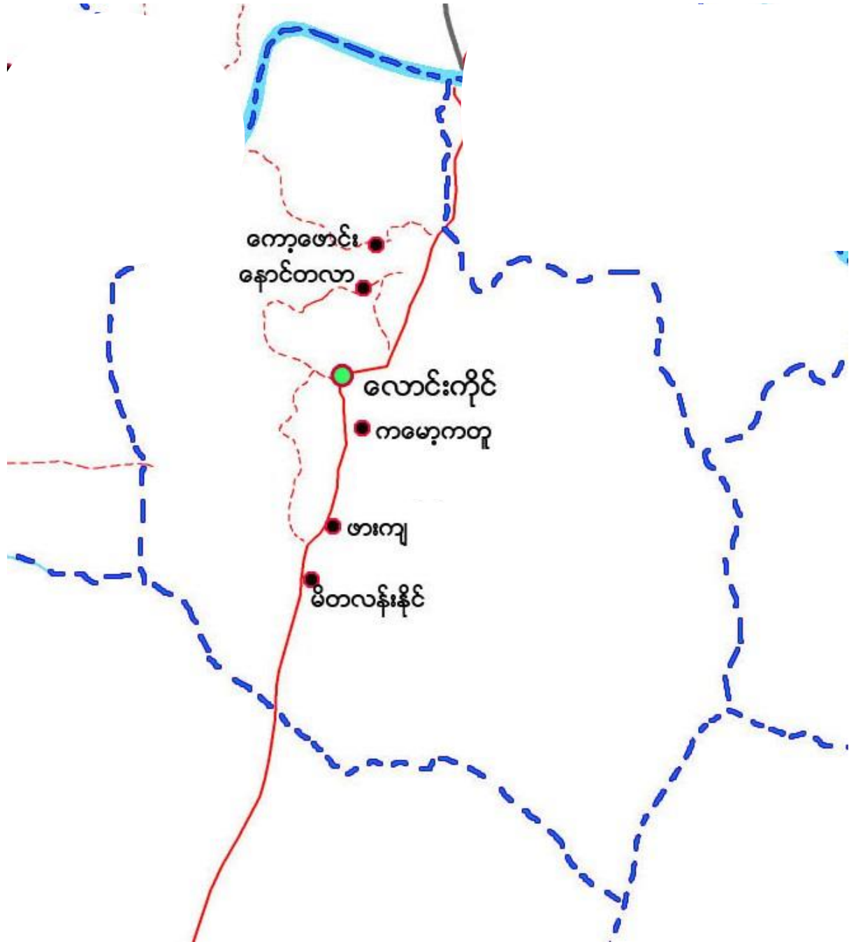
၃။ လောင်းကိုင်ကျေးရွာအုပ်စုတွင်ပါဝင်သော ကျေးရွာများစာရင်း