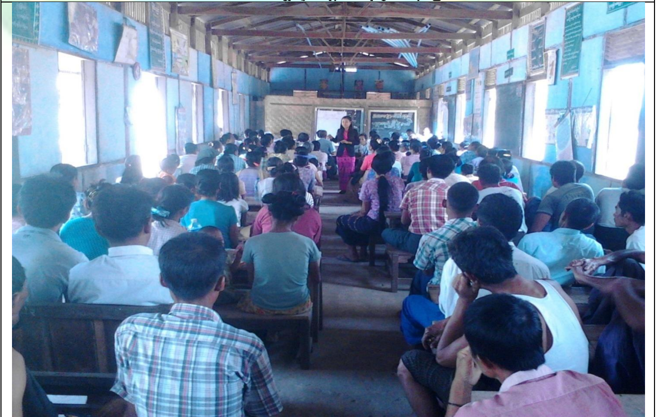
စီမံကိန်းမိတ်ဆက်အစည်းအဝေးမှတ်တမ်းဓါတ်ပုံ