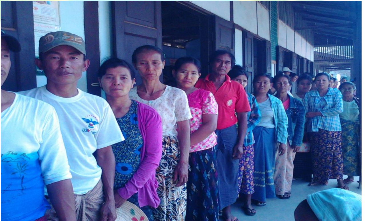
ကျေးရွာဖွံ့ဖြိုးရေးဦးစားပေးမဲပေးရန်တန်းစီနေကြစဉ်