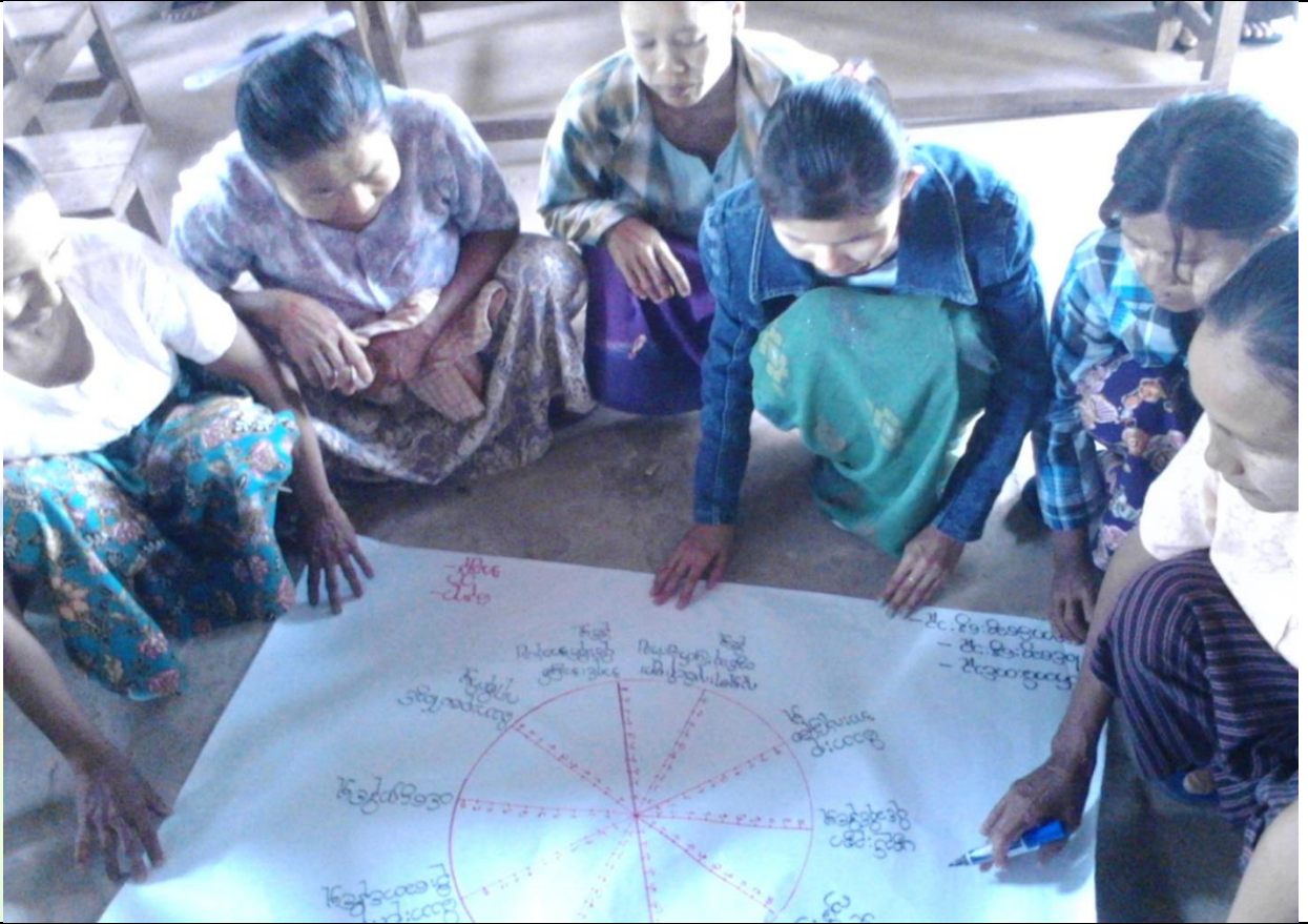
အမျိုးသမီးများပင့်ကူအိမ်ကွန်ယက်ရေးဆွဲနေစဉ်မှတ်တမ်းဓာတ်ပုံ