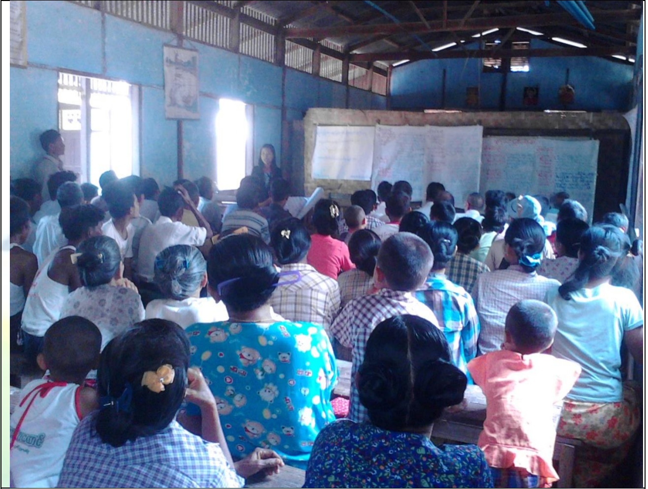
ကျေးရွာလုပ်ငန်းခွဲအတွက်အခက်အခဲများဖော်ထုတ်ဆွေးနွေးစဉ်