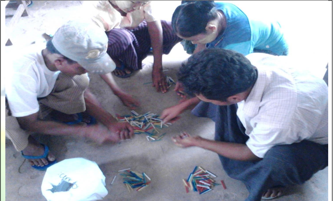
ကော်မတီရွေးချယ်ရန် မဲရေတွက်နေစဉ်