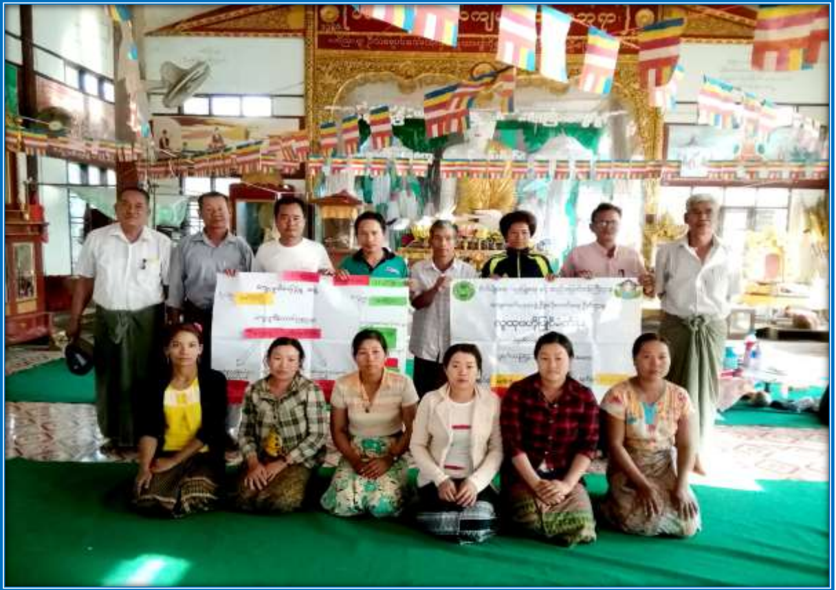
၇။ ကော်မတီဝင်များရွေးချယ်ခြင်းနှင့် ကျေးရွာဖွံ့ဖြိုးရေးအစီအစဉ်ဆောင်ရွက်မှု မှတ်တမ်းဓါတ်ပုံများ