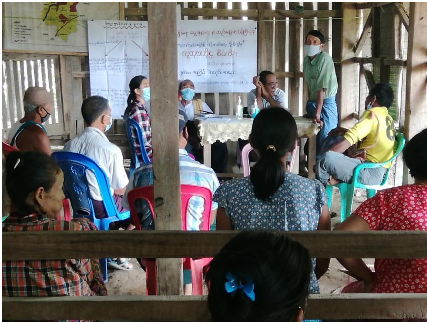
ညောင်ပင်ကြီးကွင်းကျေးရွာအုပ်စု၊ မကျည်းပင်ဆိပ်ကျေးရွာ