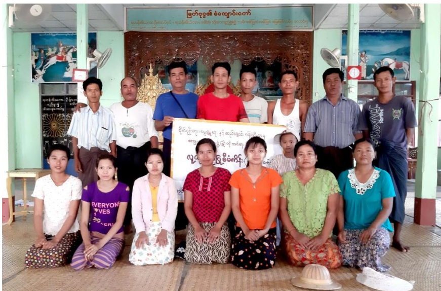
မအူပင်ကွေ့ကျေးရွာစီမံခန့်ခွဲမှုအဖွဲ့