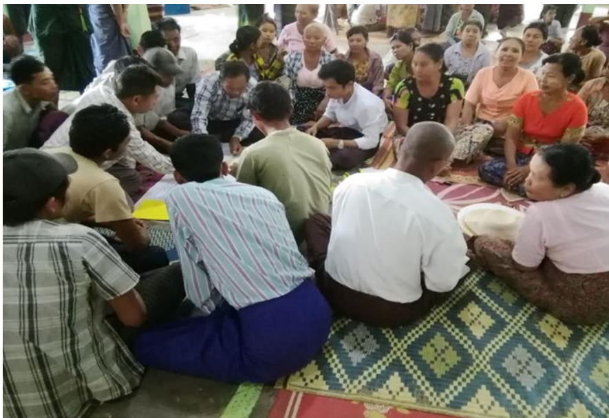
အမျိုးသားများအခက်အခဲများဆွေးနွေးနေပုံ