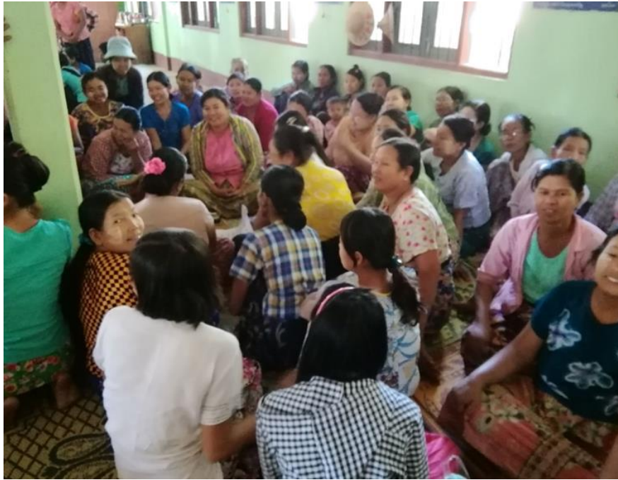
အမျိုးသမီးများအခက်အခဲများဆွေးနွေးနေပုံ