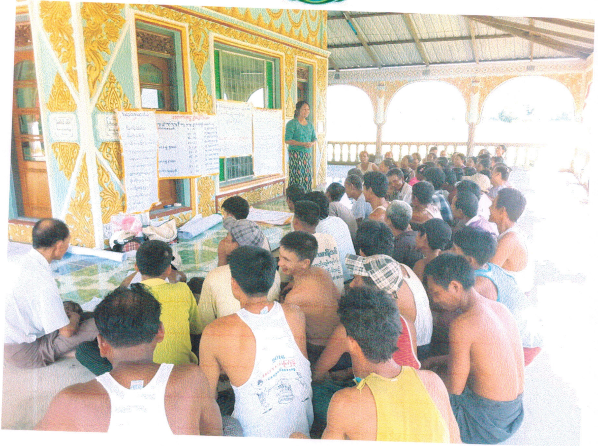
Village Development Plan