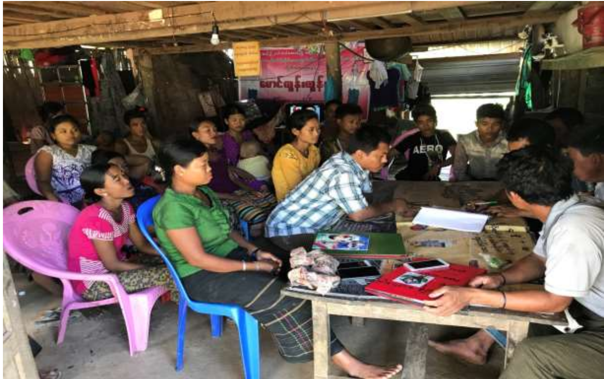
၁၈။ ကော်မတီဝင်များရွေးချယ်ခြင်းနှင့် ကျေးရွာဖွံ့ဖြိုးရေးအစီအစဉ်ဆောင်ရွက်မှုမှတ်တမ်းခါတ်ပုံများ