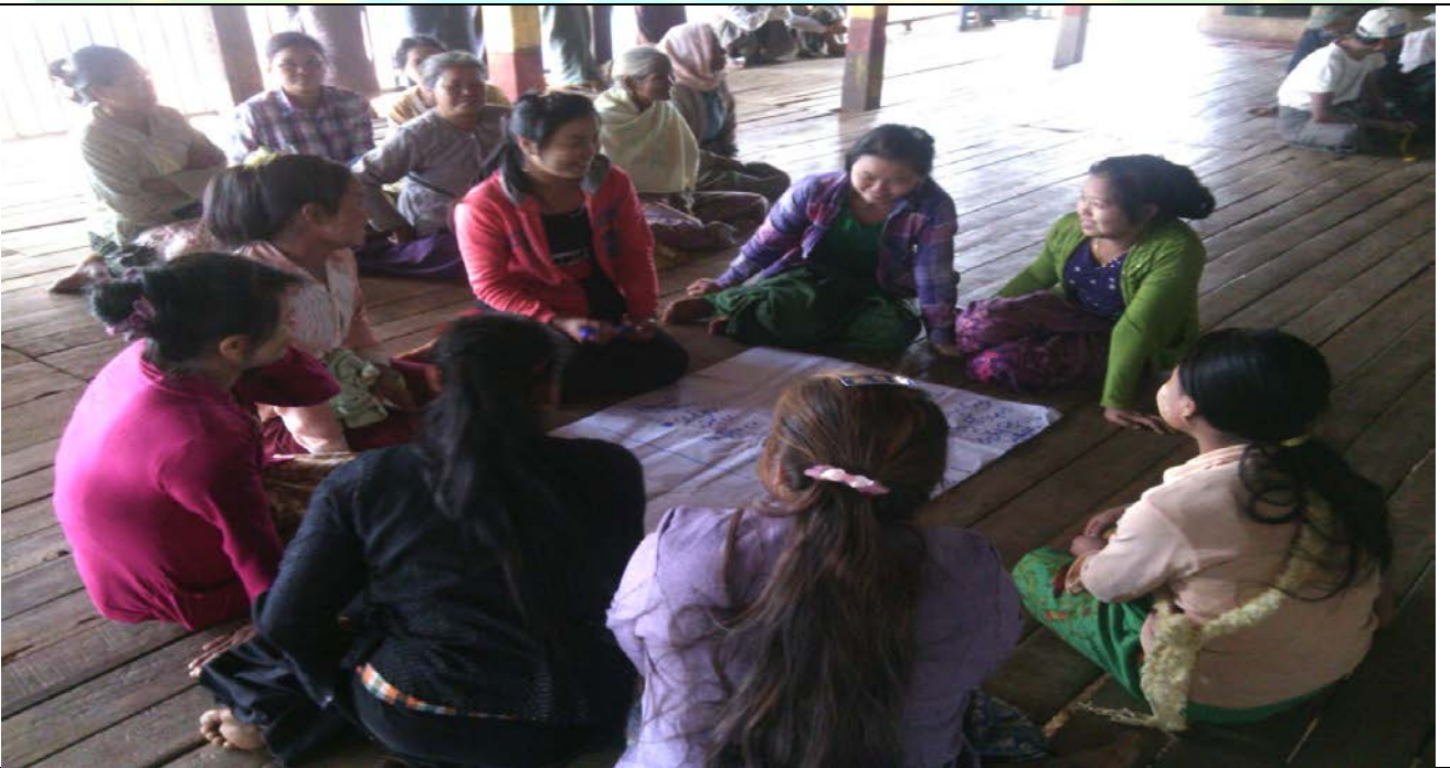
အမျိုးသမီးအုပ်စု၏မှတ်တမ်းခါတ်ပုံ