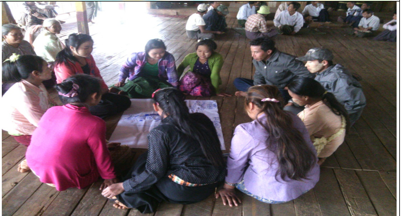
ထိခိုက်လွယ်အုပ်စုများ၏မှတ်တမ်းခါတ်ပုံ