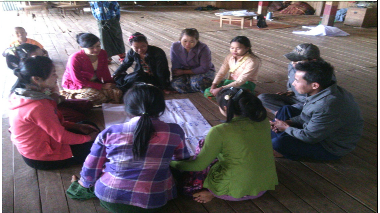
ဖွံ့ဖြိုးရေးအဖွဲ့အစည်းရေးဆွဲခြင်းမှတ်တမ်းခါတ်ပုံ