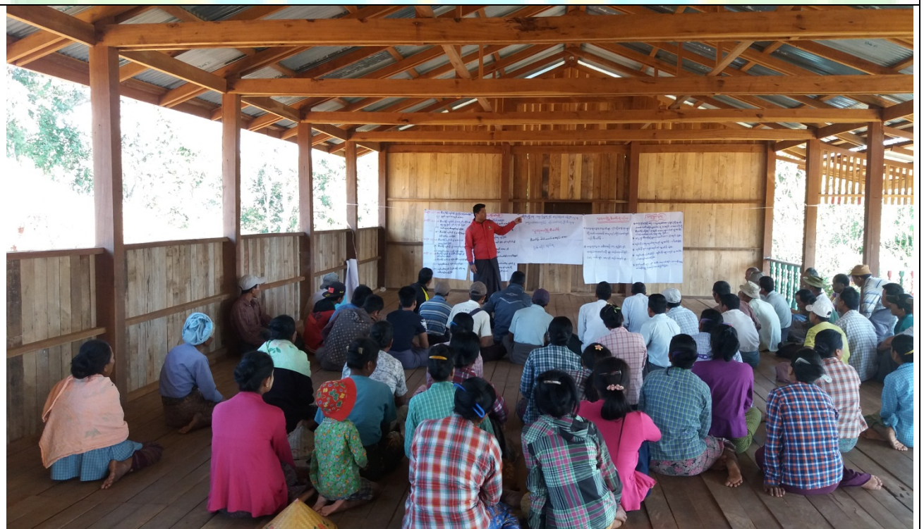
ကော်မတီရွေးချယ်ခြင်းမှတ်တမ်းဓါတ်ပုံ