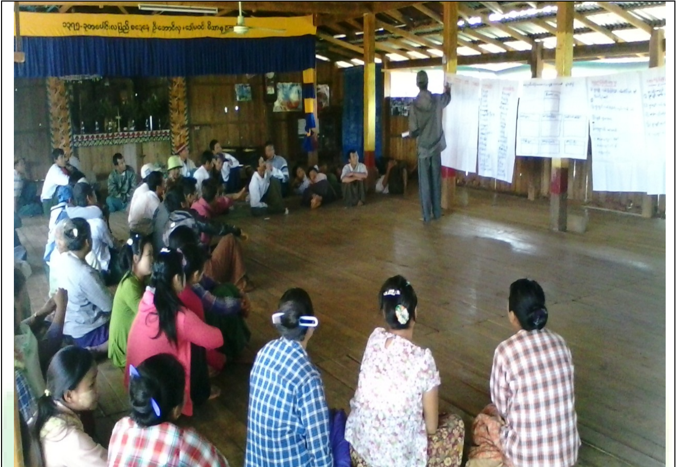
ဖွံ့ဖြိုးရေးအဖွဲ့အစည်းရေးဆွဲခြင်းမှတ်တမ်းခါတ်ပုံ