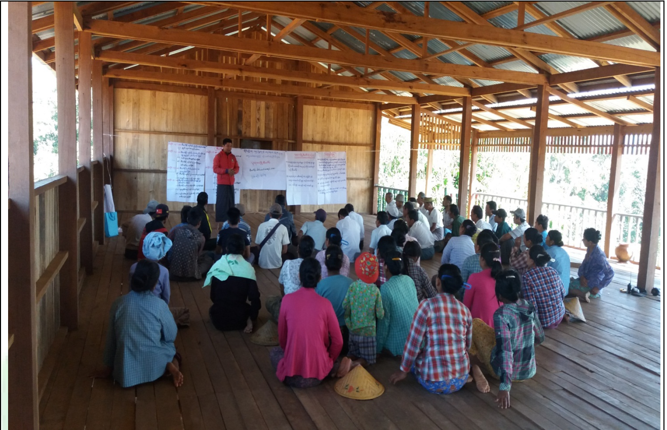
စေတနာ့ဝန်ထမ်းများရွေးချယ်ခြင်းမှတ်တမ်းဓါတ်ပုံ