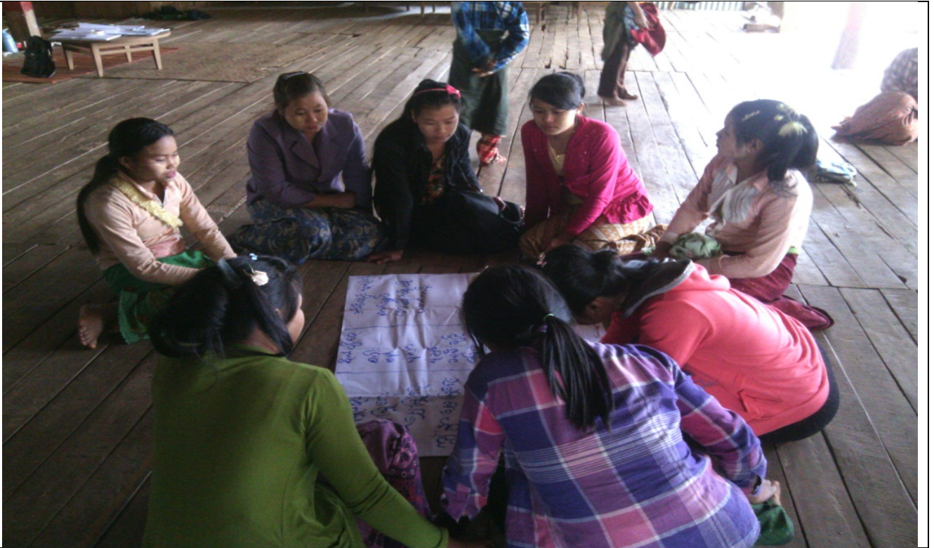
လူငယ်အုပ်စု၏မှတ်တမ်းခါတ်ပုံ