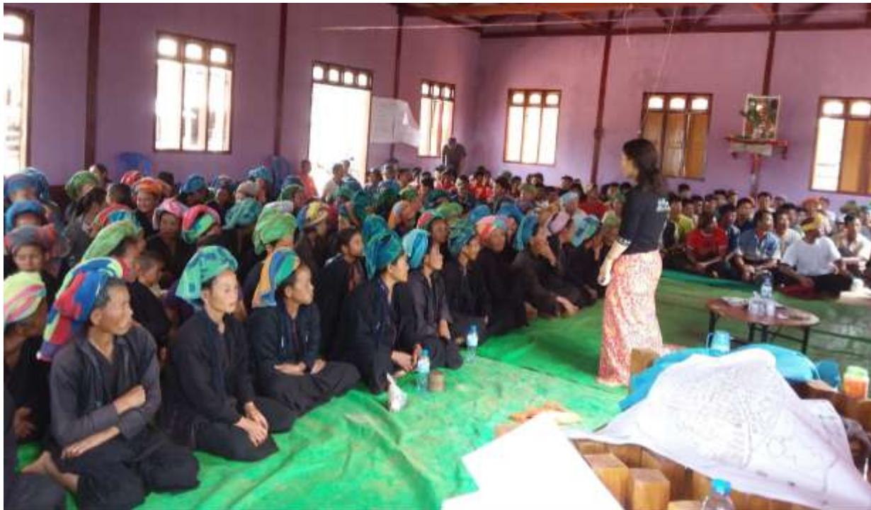
၇။ ကော်မတီဝင်များရွေးချယ်ခြင်းနှင့် ကျေးရွာဖွံ့ဖြိုးရေးအစီအစဉ် ဆောင်ရွက်မှု မှတ်တမ်း ဓါတ်ပုံများ