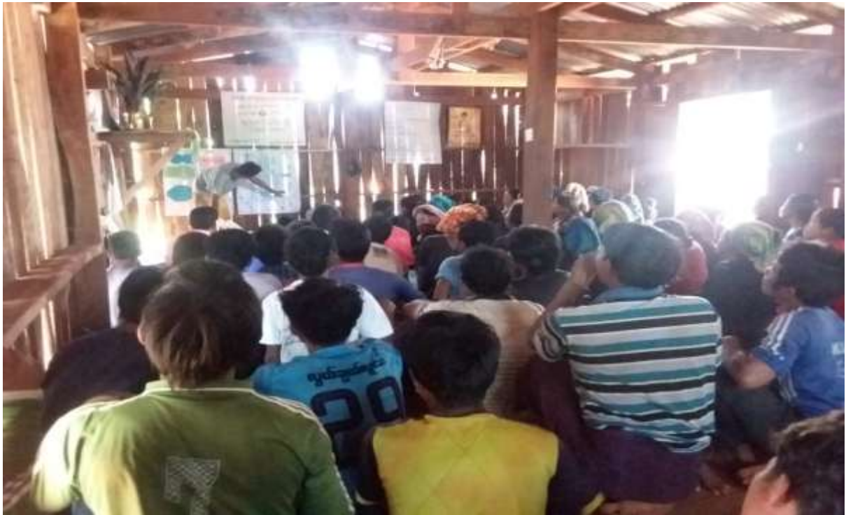
၇။ ကော်မတီဝင်များရွေးချယ်ခြင်းနှင့် ကျေးရွာဖွံ့ဖြိုးရေးအစီအစဉ် ဆောင်ရွက်မှု မှတ်တမ်း ၈