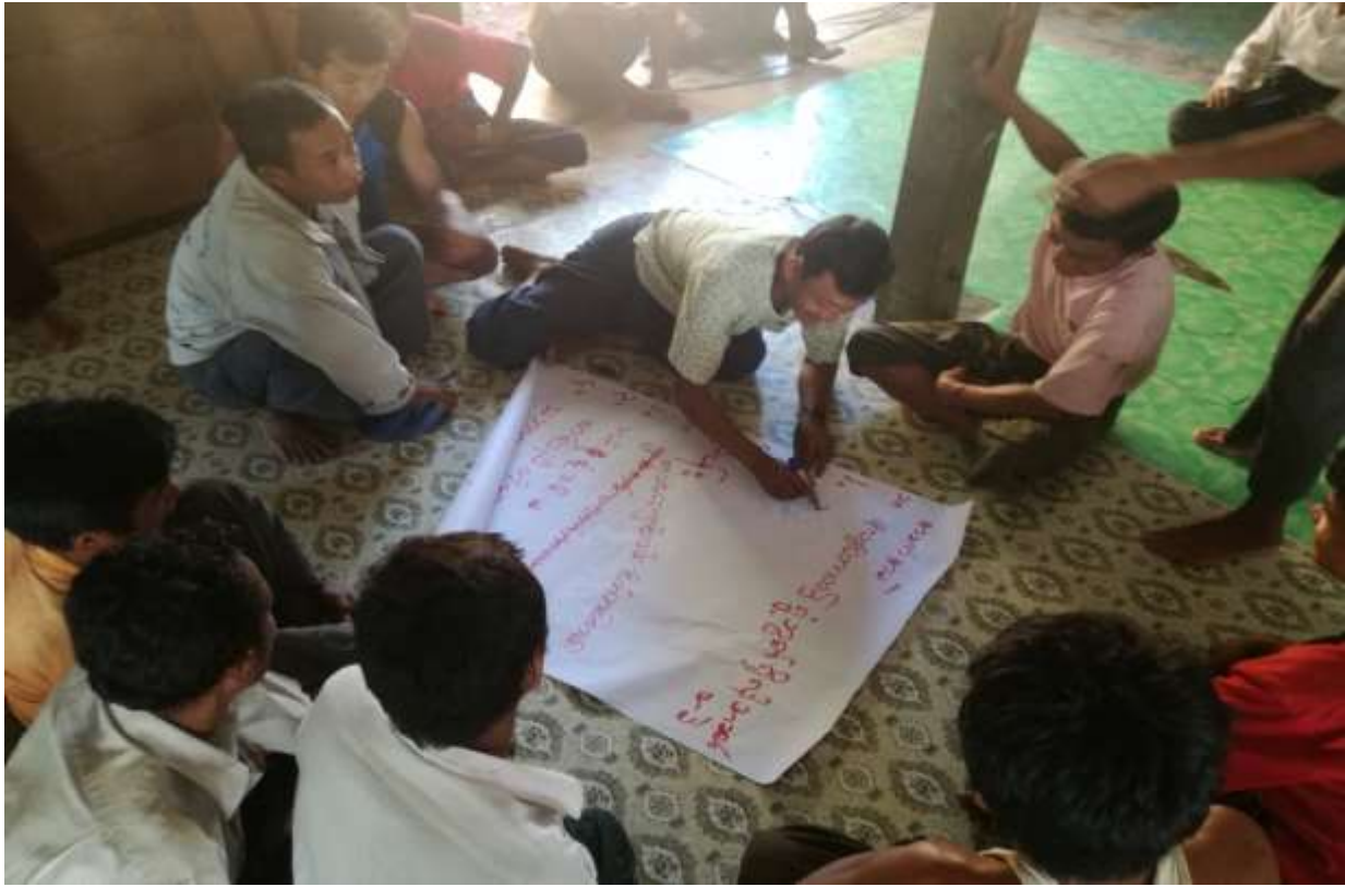
၁၈။ ကော်မတီဝင်များရွေးချယ်ခြင်းနှင့် ကျေးရွာဖွံ့ဖြိုးရေးအစီအစဉ်ဆောင်ရွက်မှုမှတ်တမ်းခါတ်ပုံများ