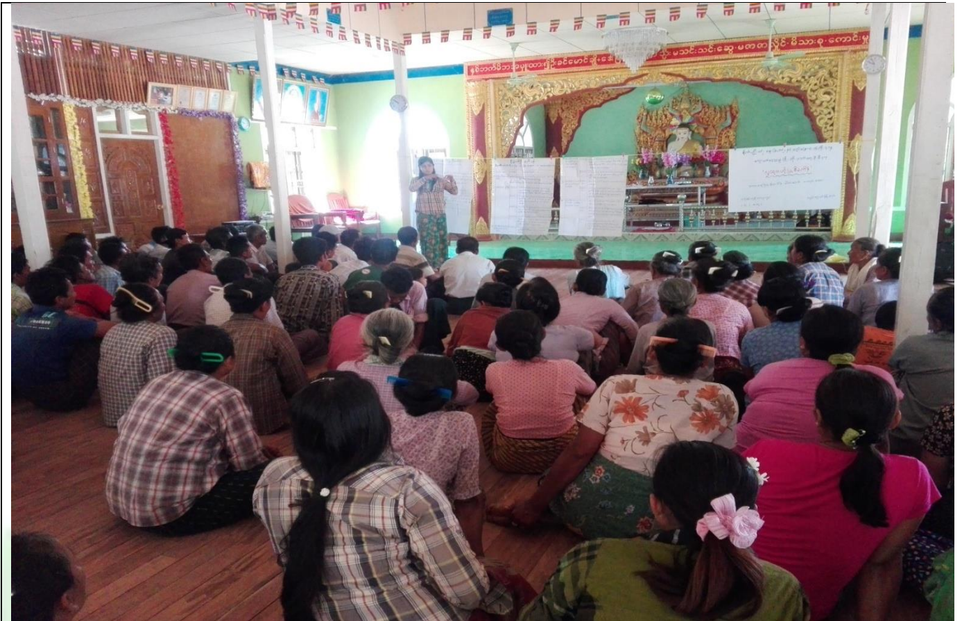
ကျေးရွာလုပ်ငန်းခွဲအတွက်အခက်အခဲများဖော်ထုတ်ဆွေးနွေးစဉ်