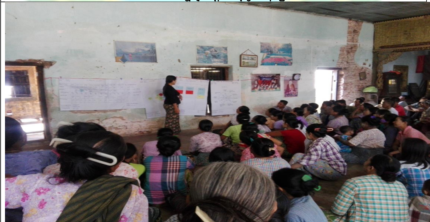
စီမံကိန်းမိတ်ဆက်အစည်းအဝေးမှတ်တမ်းဓါတ်ပုံ