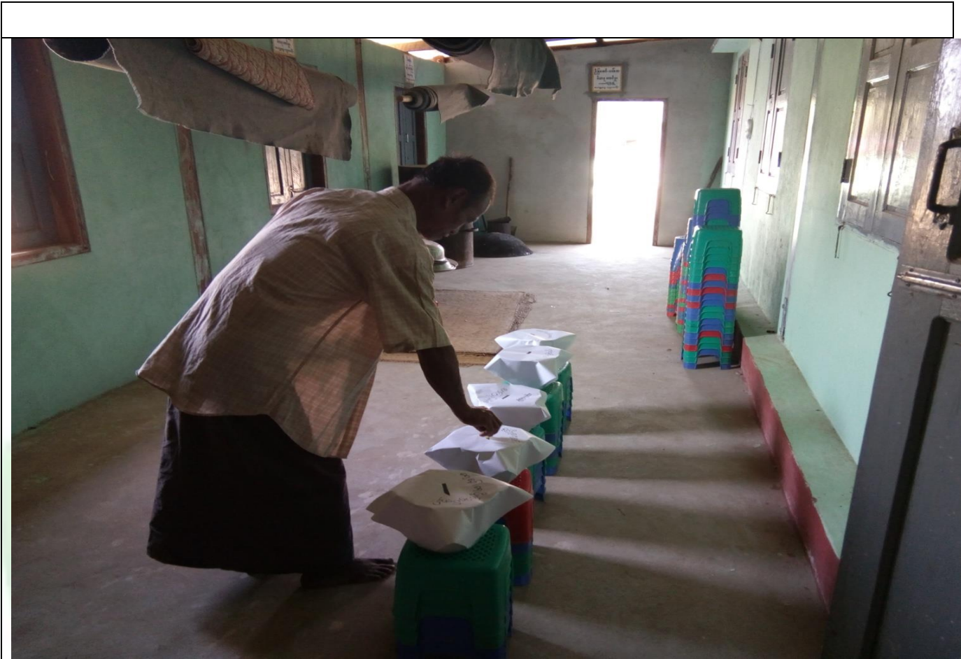
ကော်မတီရွေးချယ်ရန် မဲရေတွက်နေစဉ်