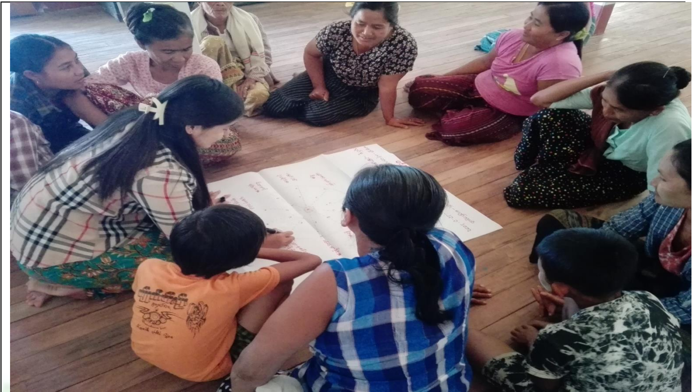
အမျိုးသမီးများပင့်ကူအိမ်ကွန်ယက်ရေးဆွဲနေစဉ်မှတ်တမ်းဓာတ်ပုံ