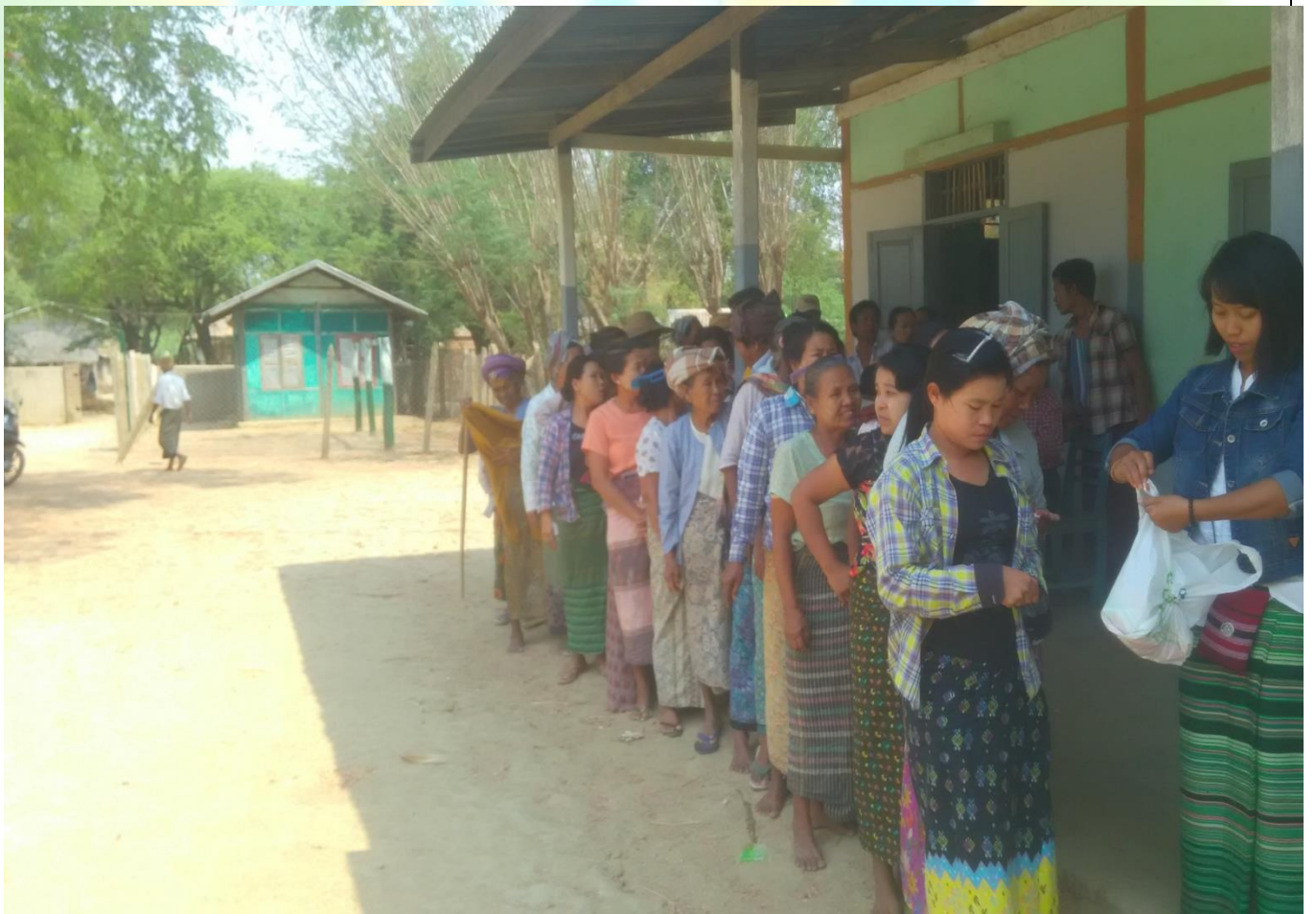
ကျေးရွာဖွံ့ဖြိုးရေးဦးစားပေးမဲပေးရန်တန်းစီနေကြစဉ်