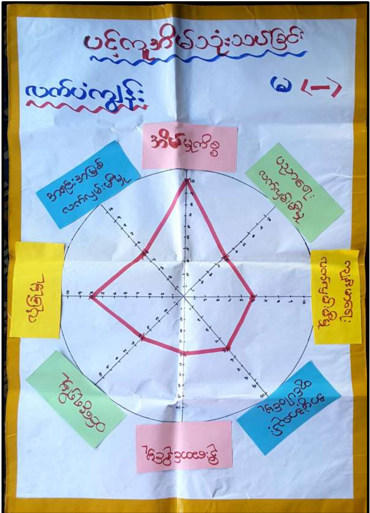
လက်ပံကျွန်းကျေးရွာ၊ လက်ပံကျွန်းကျေးရွာအုပ်စု၊ပေါင်မြို့နယ်။