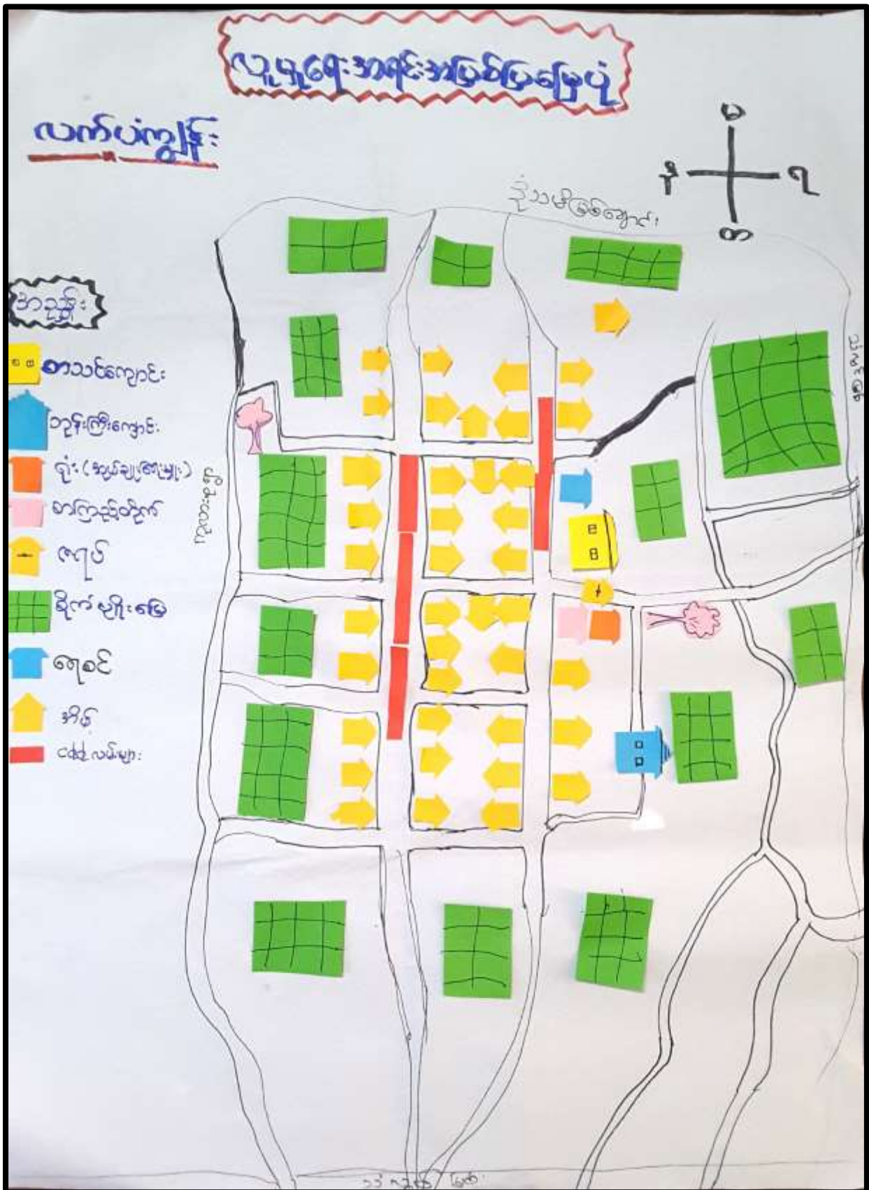
လက်ပံကျွန်းကျေးရွာ၊ လက်ပံကျွန်းကျေးရွာအုပ်စုပေါင်မြို့နယ်။

၆။ လက်ပံကျွန်းကျေးရွာ ဖွံ့ဖြိုးရေး အစီအစဉ်အတွက် အသုံးပြုခဲ့သော PRA tools များနှင့် တစ်ခုချင်းစီအတွက် သုံးသပ်ချက်များ