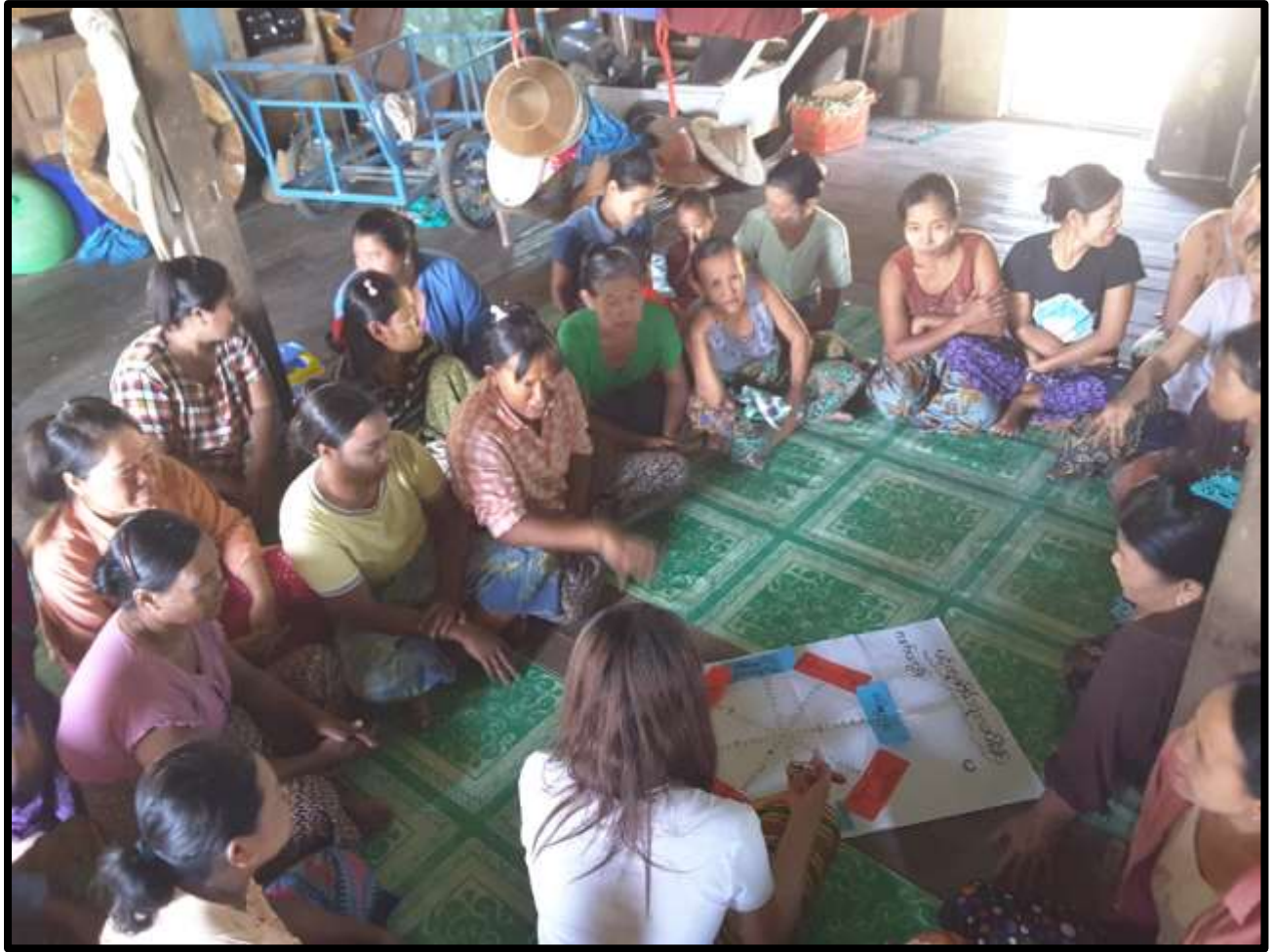
လက်ပံကျွန်းကျေးရွာ၊ လက်ပံကျွန်းကျေးရွာအုပ်စု၊ပေါင်မြို့နယ်။