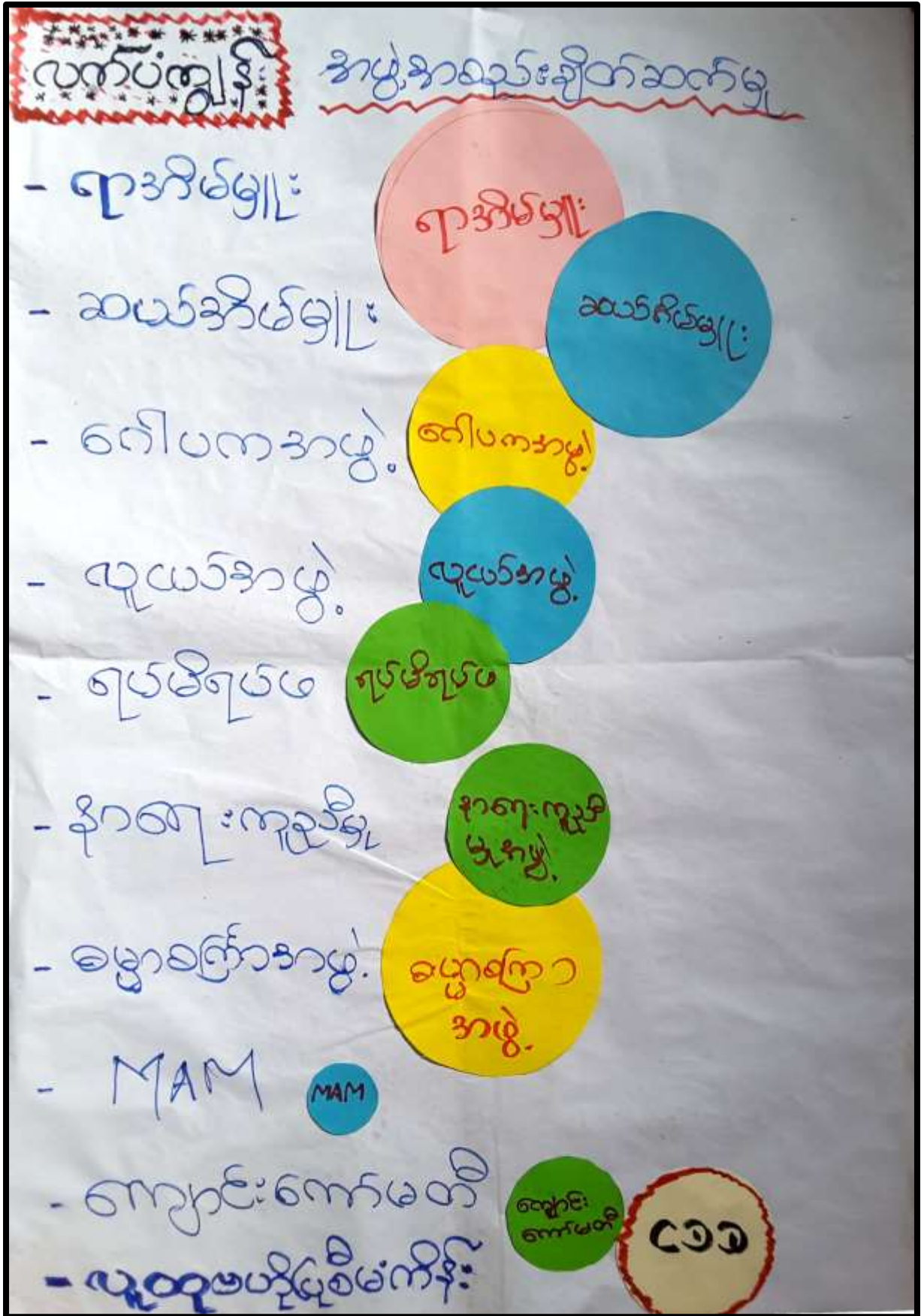
လက်ပံကျွန်းကျေးရွာ၊ လက်ပံကျွန်းကျေးရွာအုပ်စု၊ပေါင်မြို့နယ်။