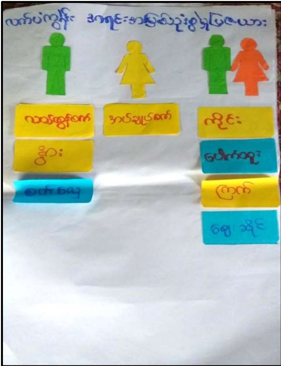
လက်ပံကျွန်းကျေးရွာ၊ လက်ပံကျွန်းကျေးရွာအုပ်စု၊ပေါင်မြို့နယ်။