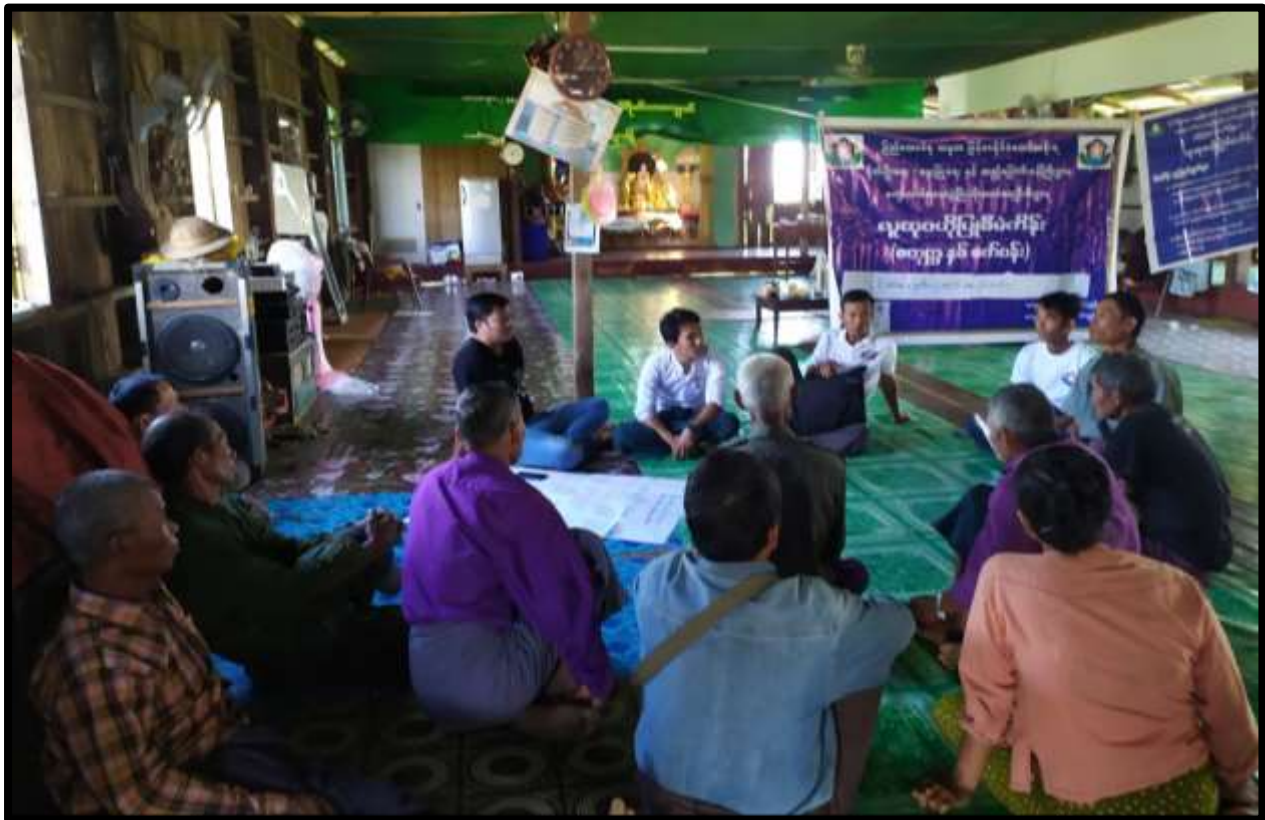
လက်ပံကျွန်းကျေးရွာ၊ လက်ပံကျွန်းကျေးရွာအုပ်စု၊ပေါင်မြို့နယ်။