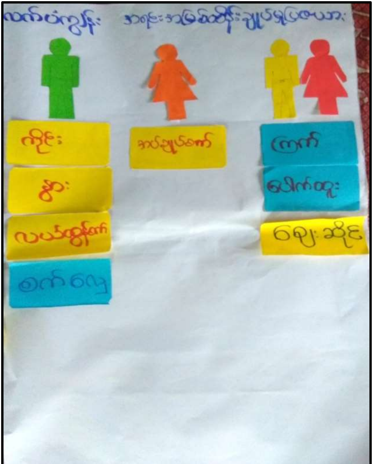
လက်ပံကျွန်းကျေးရွာ၊ လက်ပံကျွန်းကျေးရွာအုပ်စု၊ပေါင်မြို့နယ်။