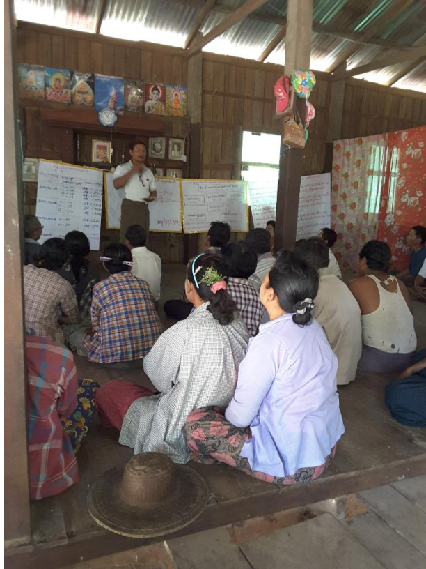
သာပေါင်းမြို့နယ်၊ သရက်ကုန်းအုပ်စု၊ လေပွေကုန်းကျေးရွာတွင် PRA Tools များ ပြုလုပ်ပုံ