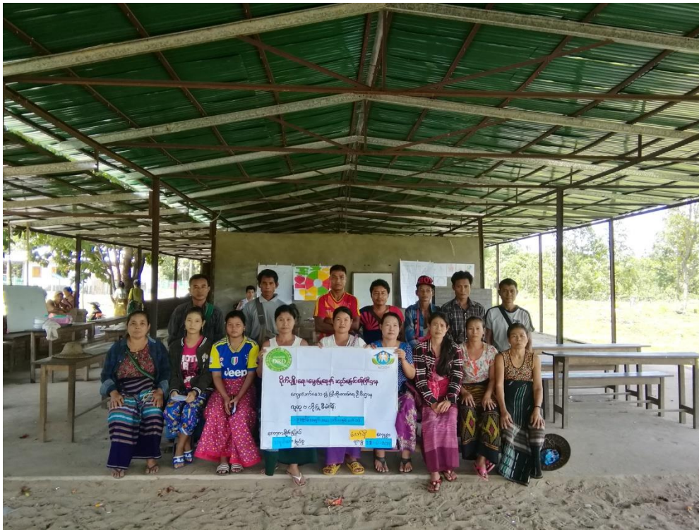
သရက်တောကျေးရွာအုပ်စု၊ လော်ရီကျေးရွာ ၂၀၁၉-ခုနှစ်

လူထုပတ်ဝန်းကျင်ဖွံ့ဖြိုးရေး ကော့ကရိတ်မြို့နယ်၊ ကရင်ပြည်နယ် ကျေးရွာဖွံ့ဖြိုးရေးအစီအစဉ်