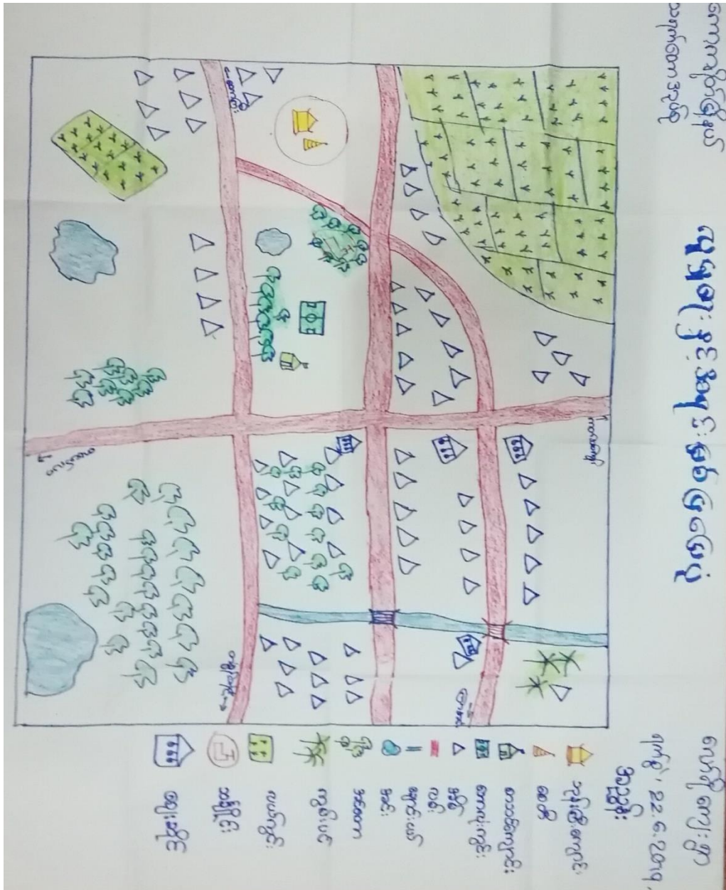
လော်ရီကျေးရွာ၏ လူမှုရေးနှင့် အရင်းအမြစ်ပြမြေပြင် (Social and Resource Map)