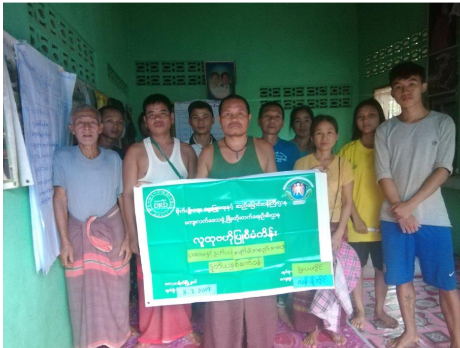
ကရင်ပြည်နယ်၊ ကော့ကရိတ်မြို့နယ်၊ မြပတိုင်ကျေးရွာအုပ်စု လန်းခိုဘိုင်းကျေးရွာ၏ ဖွံ့ဖြိုးရေးအစီအစဉ် ၂၀၂၀ပြည့်နှစ် (တတိယနှစ်စက်ဝန်း)