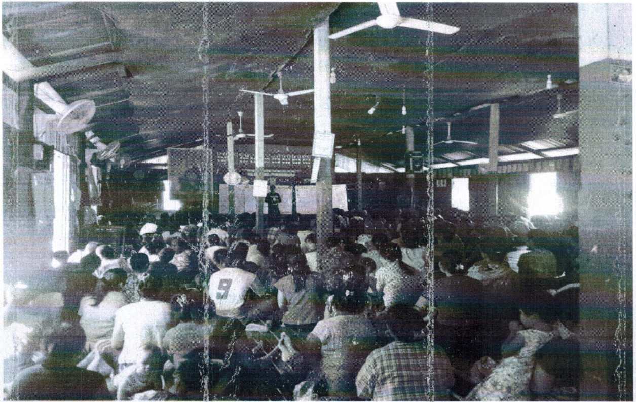
ကော်မတီဝင်များရွေးချယ်ခြင်းနှင့်ကျေးရွာဖွံ့ဖြိုးရေးအစီအစဉ်ဆောင်ရွက်မှုမှတ်တမ်းခါတ်ပုံများ