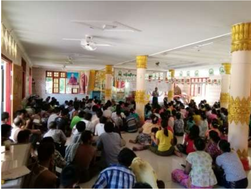
စီမံကိန်းမိတ်ဆက်အစည်းအဝေး မှတ်တမ်းတင်ခါတ်ပုံ။

၈။ ကော်မတီဝင်များရွေးချယ်ခြင်းနှင့် ကျေးရွာဖွံ့ဖြိုးရေးအစီအစဉ်ဆောင်ရွက်မှု မှတ်တမ်း ခါတ်ပုံများ