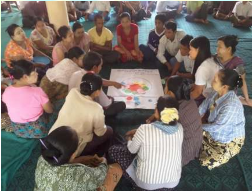
လူမှုဆန်းစစ်ခြင်း မှတ်တမ်းခါတ်ပုံ