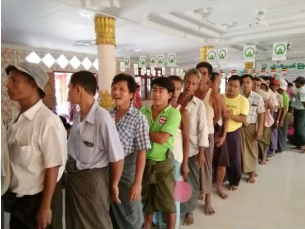
ဗွဲ့ဖွဲ့ရေးစီမံချက်ရေးဆွဲသည့် အစည်းအဝေးမှတ်တမ်း ဓါတ်ပုံ