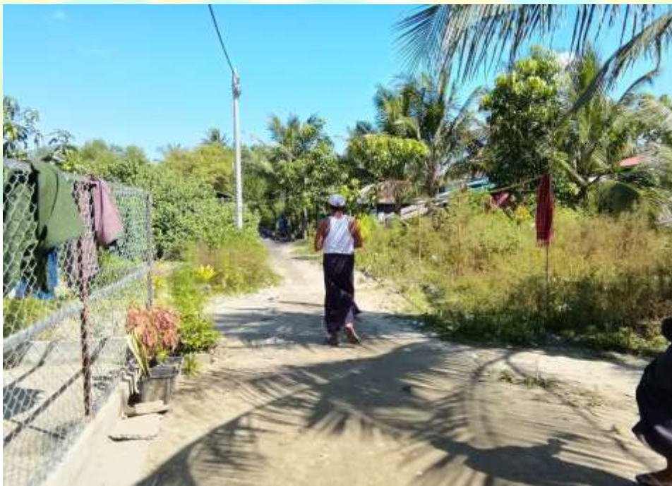
စီမံကိန်းလုပ်ငန်းခွဲ မစတင်မီ မှတ်တမ်းဓါတ်ပုံ