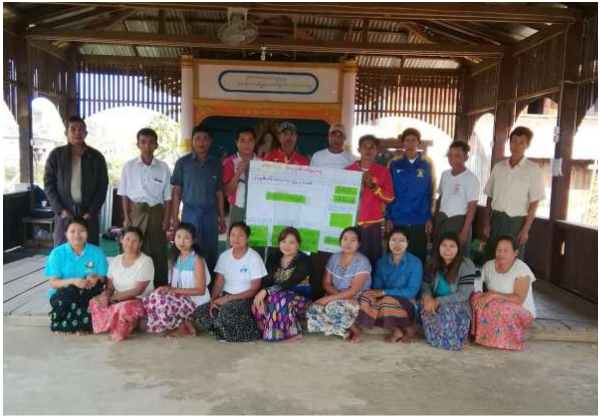
၇။ ကော်မတီဝင်များရွေးချယ်ခြင်းနှင့် ကျေးရွာဖွံ့ဖြိုးရေးအစီအစဉ်ဆောင်ရွက်မှု မှတ်တမ်းဓာတ်ပုံများ